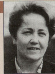
Hildegard Fässler, Nationalrätin SP.

Wenn in diesem Rahmen auch einmal eine Lektion der heutigen Schweizer Armee gewidmet wird, so ist dagegen nichts einzuwenden. Es wird bei dieser Gelegenheit sicher auch auf die Möglichkeit des Zivildienstes hingewiesen werden.