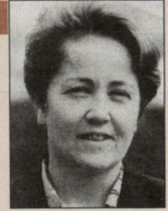
Hildegard Fässler, Nationalrätin SP.