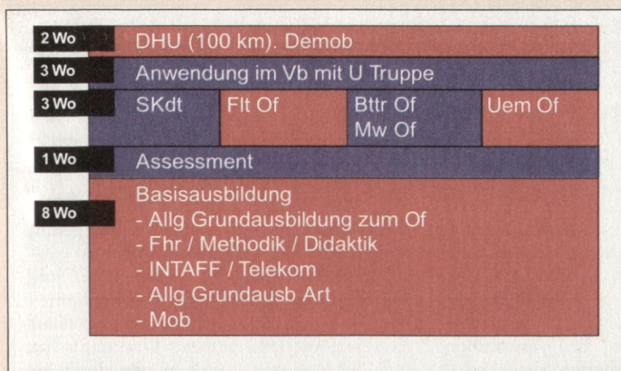
Modell Art OS 2001.