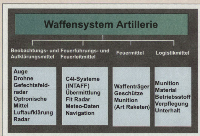
Beob/Aufkl, Feuer- und Logistikmittel.