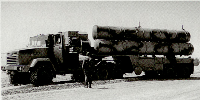
Abschussfahrzeug des russischen Luftverteidigungssystems S-300 PMU.

Gegenwärtig ist bei allen Golfstaaten ein Rückgang bei den Rüstungsbeschaffungen feststellbar. Die während der Ausstellung getätigten Bestellungen betreffen in diesem Jahr eher unwesentliche Bereiche und sind auf verschiedene Staaten aufgeteilt worden. Der von den USA angestrebte Verkauf von weiteren «Patriot»-Systemen