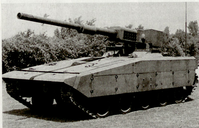
Der Prototyp eines sogenannten «Expeditionary Tank» zeigt den möglichen Entwicklungstrend für künftige schwere Kampffahrzeuge auf.