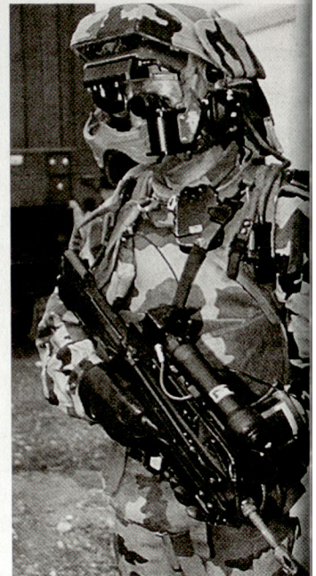
Moderne Ausrüstung für Soldaten des französischen Heeres.

Bisher beschränkt sich die Entwicklung solcher moderner Ausrüstung für Einzelkämpfer lediglich auf die USA und Grossbritannien. Frankreich ist somit das dritte Land, das im Zusammenhang mit den laufenden Heeresreformen eine umfassende Digitalisierung des militärischen Einsatzes vorsieht. In diesem Zusammenhang wird nun von französischer Seite auch der diesbezügliche Kontakt zu den Versuchsstellen der britischen und US-Army gesucht. hg