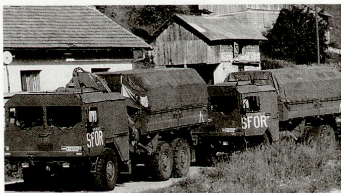
Die Beteiligung Österreichs an friedensunterstützenden Operationen (wie z.B. bei der SFOR) soll aktiv weitergeführt werden.

allerdings weiter bestehen, d.h., jeder Partner hat das Recht, das Ausmass seiner Zusammenarbeit mit der NATO und den anderen Partnern selber zu bestimmen. Eine Verpflichtung der Teilnahme an spezifischen PfP-Aktivitäten besteht also auch weiterhin nicht. Erste Auswirkungen dieser erweiterten Partnerschaft für den Frieden sind unterdessen bereits ersichtlich. So wurden für die Planungsvorbereitungen im Hinblick auf eine Friedensmission im Kosovo (KFOR) auch die Partner, die an dieser «vertieften PfP» teilnehmen, beigezogen. hg