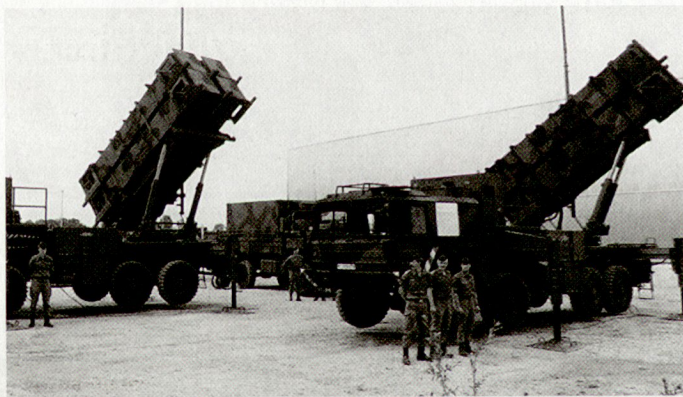
«Patriot»-Lenkwaffensysteme stehen u.a. heute in Israel, Saudi Arabien und Kuwait im Einsatz.

z.B. an die Vereinigten Arabischen Emirate sowie allenfalls auch an Oman konnte nicht realisiert werden. Bis heute haben sich in dieser Region Kuwait und Saudi Arabien mit solchen Abwehrsystemen eingedeckt. Russland darf also weiterhin auf diesbezügliche Bestellungen hoffen. hg