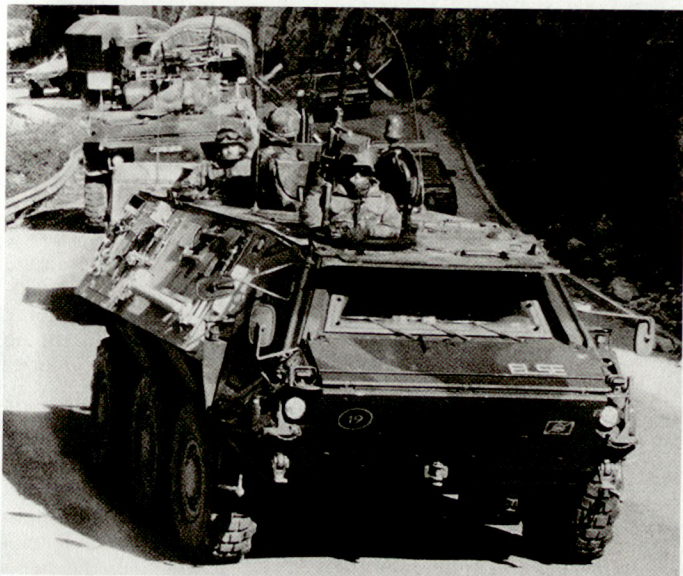
Der Einsatz von KRK-Truppen (Bild: Schützenpanzer «Fuchs» in Bosnien) kommt die Bundeswehr zunehmend teuer zu stehen.

der Drohne CL-289, die das wichtigste Aufklärungsmittel über dem Kosovo ist, kostet 80000 DM. In Zukunft werden die Kosten für die Einsätze im früheren Jugoslawien nicht mehr allein aus dem Verteidigungshaushalt zu bestreiten sein. Bundeskanzler Schröder hat auf der Wehrkundetagung in München entsprechende Fragen ausweichend beantwortet. Die Bundesregierung werde selbstverständlich für die Kosten aufkommen. Aus welchem Etat das geschehen soll, müsse noch entschieden werden. Es geht hier für die Bundeswehr letztlich um Planungssicherheit und ihre finanzielle Abdeckung. Von dem vorgesehenen Finanzrahmen von 47,5 Mia. DM, dem weitere Kürzungen drohen, müssen 35,5 Mia. DM für Betrieb und Personal aufgebracht werden. Angesichts der unausweichlichen anderen Kosten bleibt für Innovation nur ein ganz geringer Raum. Hierdurch ist die Bundeswehr bereits jetzt schon hinsichtlich der Materialerhaltung und -erneuerung in eine schwierige Lage gekommen. Wer meint, es könne bei Abschaffung der allgemeinen Wehrpflicht, Verkleinerung der Bundeswehr auf 20000 Mann und Umstellung auf eine Berufsarmee Geld eingespart werden, irrt sich. Wehrpflichtige und Wehrübende kosten heute im Jahr zirka 15000 DM pro Mann, ein Berufssoldat oder Soldat auf Zeit erforderte mehr als den 5fachen Betrag pro Kopf. Tp.