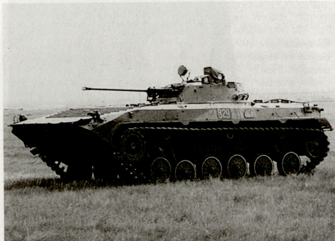
Veralteter russischer Schützenpanzer BMP-2.