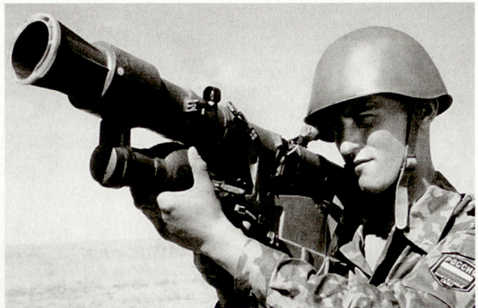
Entwicklung von technischen Schutzmassnahmen gegen die Bedrohung durch Einmann-Flablenk Waffen (Bild: SA-18 «Igla») sind heute eine Notwendigkeit.

Nebst der Informationssicherheit kümmert sich das CELAR auch um folgende Phänomene: