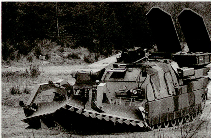
Geniepanzer «LeClerc DNG» ausgerüstet mit Kranausleger, Räum-schaufel und Minenräumgerät.

Das französische Budget für das laufende Jahr legt einen weiteren Schwerpunkt auf eine starke europäische Verteidigungsindustrie: Mehr als 8 Mia FF (zirka 2 Mia SFr.) fliessen deshalb in die deutsch-französi-