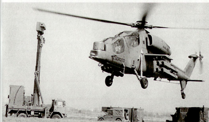
Die Restrukturierung des italienischen Heeres soll mehr Flexibilität und Mobilität bringen.

Die gesteigerte Bedeutung von Fremdsprachenkenntnissen in den Streitkräften zeigt, dass die Aufgabe militärischer Einrichtungen schon lange nicht mehr nur allein mit den «traditionellen militärisch-handwerklichen» Fähigkeiten bewältigt werden kann. RZE