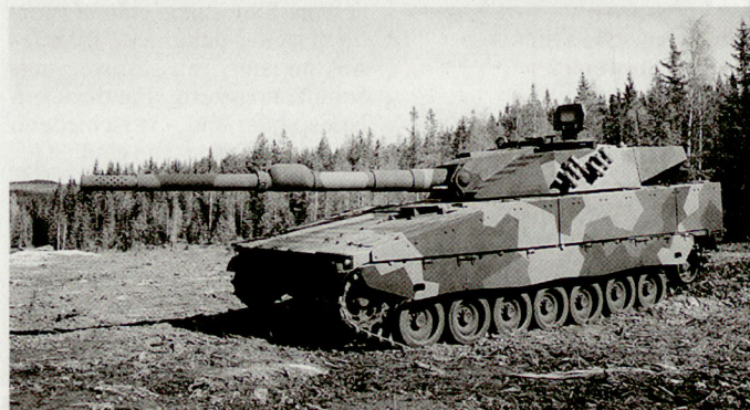
Prototyp des leichten Panzers CV-90120 mit Kanone 120 mm. ■

gestell des schwedischen Schützenpanzers CV-90 ein falsches Foto benutzt worden. Bei der verwendeten neuen Kanone 120 mm handelt es sich um eine Entwicklung der SW in Thun: «SW Schweizerische Unternehmung für Waffensysteme AG» (neue Bezeichnung). hg