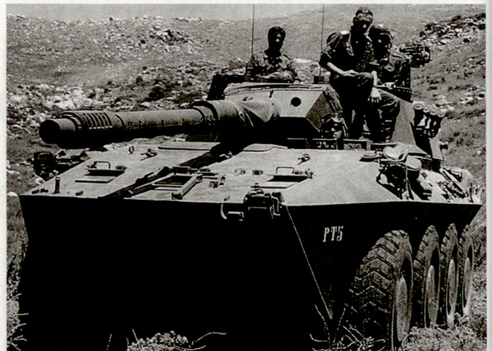
Kampffahrzeug «Centauro», ausgerüstet mit Kanone 105 mm zur Unterstützung der «Extraction Force».

Der Aufmarsch der Extraction Force (siehe auch ASMZ 2/1999, Seite 45) war am 10. Januar 1999 abgeschlossen. Bei einer Eskalation der Ereignisse im Kosovo soll das bestehende Kontingent von rund 1700 Mann rasch mit zusätzlichen Soldaten aus den beteiligten Staaten (Frankreich, Italien, Grossbritannien, Niederlande, Deutschland und Kanada) verstärkt werden. Das Einsatzspektrum umfasst primär den Schutz und allenfalls auch eine Evakuierung des KVM-Personals (darunter auch Schweizer) bei einer entsprechenden Verschärfung der Lage im Kosovo. hg