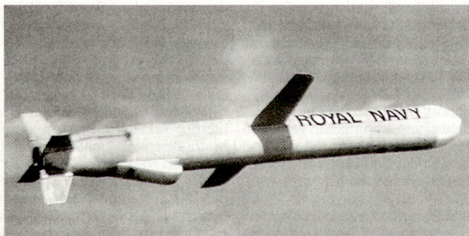
Marschflugkörper «Tomahawk» für die britische Royal Navy.

Die seegestützten Marschflugkörper vom Typ «Tomahawk» wurden – nach den gewonnenen Einsatzerfahrungen durch die US Navy – in den letzten Jahren ständig weiterentwickelt. Verbesserungen erfolgten insbesondere bezüglich Reichweite sowie Treffgenauigkeit. Zudem wurden auch neue Gefechtskopfvarianten entwickelt, um die künftigen Einsatzmöglichkeiten dieser Waffen zu erweitern. hg