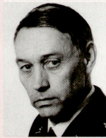
KKdt Rudolf Zoller, 1940, Kommandant des Feldarmeekorps 2