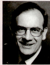
KKdt Beat Fischer, 1943, Kommandant des Gebirgsarmee- korps 3