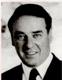
Bundesrat Adolf Ogi, 1942 Chef VBS