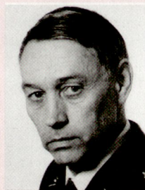
KKdt Rudolf Zoller, 1940, Kommandant des Feldarmee- korps 2