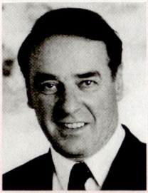
Bundesrat Adolf Ogi, 1942 Chef VBS