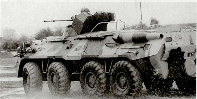
Version BTR-80 A.