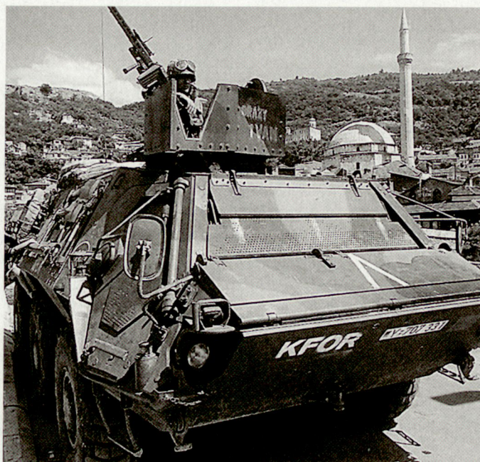
Transportpanzer «Fuchs», versehen mit Zusatzpanzerungen.