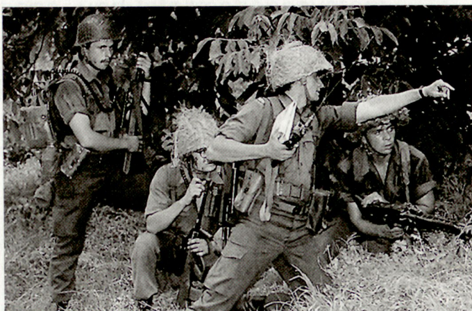
Präsenz von drei Jägerbrigaden im österreichischen Bundesheer.

Im Bundesland Wien sind im weiteren ein Jägerregiment und die Garde (in Regimentsgrösse) als präsenste Truppen formiert worden. Als territoriale und