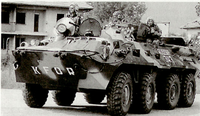
Grundversion BTR-80 bei russischen Luftlandetruppen in Kosovo.

bekannten russischen Typen «Konkurs» (AT-5) oder «Fagot» (AT-4) sowie neuerdings auch die moderne lasergelenkte «Kornet» (AT-14) zur Auswahl. Der neue BTR-90 kann zudem mit einem – ebenfalls aus russischer Produktion stammenden – Bordinformationssystem sowie mit Wärmebildgerät ausgerüstet werden. Auch die russische Armee hat im Zusammenhang mit den laufenden friedensunterstützenden Einsätzen einen grossen Bedarf an modernen Kampffahrzeugen. Schützenpanzer vom Typ BTR-80 stehen dabei nicht nur bei den mechanisierten Einheiten, sondern vermehrt auch bei den Luftlandetruppen (z.B. bei den russischen Fallschirmjägerbataillonen innerhalb SFOR und KFOR) im Einsatz. Allerdings verhindert die prekäre finanzielle Situation Russlands eine grössere Beschaffung solcher Fahrzeuge. hg