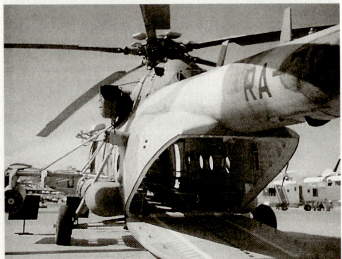
Mehrzweckhelikopter Mi-17 der tschechischen Streitkräfte. ■

Neben den acht MiG-21 MFN wurden unterdessen auch einige Helikopter Mi-17 «Hip-H» den neuen Anforderungen angepasst. Die Anpassung weiterer Helikopter dieses Typs ist vorgesehen. Erst im Jahre 2001 sollen die ersten Leichtkampfflugzeuge L-159 bereitstehen, die dann vermutlich auch umgehend die veralteten MiG-21 MFN ersetzen sollen. Die L-159 stammen bekanntlich aus eigener tschechischer Produktion und wurden primär aus wirtschaftlichen Überlegungen in Auftrag gegeben. Längerfristig dürfte aber auch die tschechische Luftwaffe nicht darum herumkommen, eine kleine Tranche modernerer westlicher Kampfflugzeuge zu beschaffen. hg