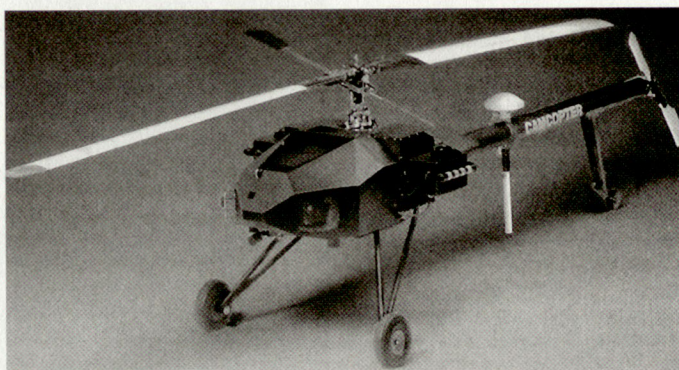
Die österreichische Kleindrohne «Camcopter».

Der «Camcopter» hat das Aussehen eines Modellhelikopters; er ist zirka 2,5 m lang und hat ein Leergewicht von 27 kg.