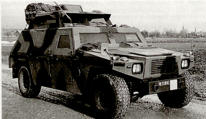
Neuste Version des Aufklärungsfahrzeuges «Eagle II».

herigen Erfahrungen bei den laufenden friedensunterstützenden Missionen haben die Notwendigkeit solcher Fahrzeuge, besonders im Zusammenhang mit Kontroll- und Überwachungsaufgaben – deutlich aufgezeigt. Im Hinblick auf den dänischen Einsatz in Kosovo hat die Gruppe Rüstung – im Einverständnis mit dem Generalstabschef der Schweizer Armee – der Vermietung von drei weiteren Aufklärungsfahrzeugen