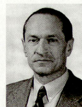
Oberst Peter Grütter ist Kommandant der Zürcher Kantonspolizei.

«Die Aktivitäten der Polizei zur Kriminalitätsbekämpfung und für die Aufrechterhaltung von Recht und Ordnung sind von erhöhter Bedeutung und sollen – unter Zuteilung der notwendigen Mittel, wobei auch Umverteilungen geprüft werden müssen – auf allen Stufen verstärkt werden.»