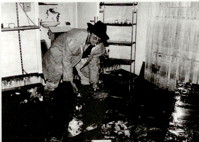
Hochwasserschaden im Wohnzimmer eines Wohnblocks an der Lettenmattstrasse in Birmensdorf ...

Diese Katastrophenplanung hatte noch einen weiteren gravierenden Mangel. Alle sorgfältig und nach