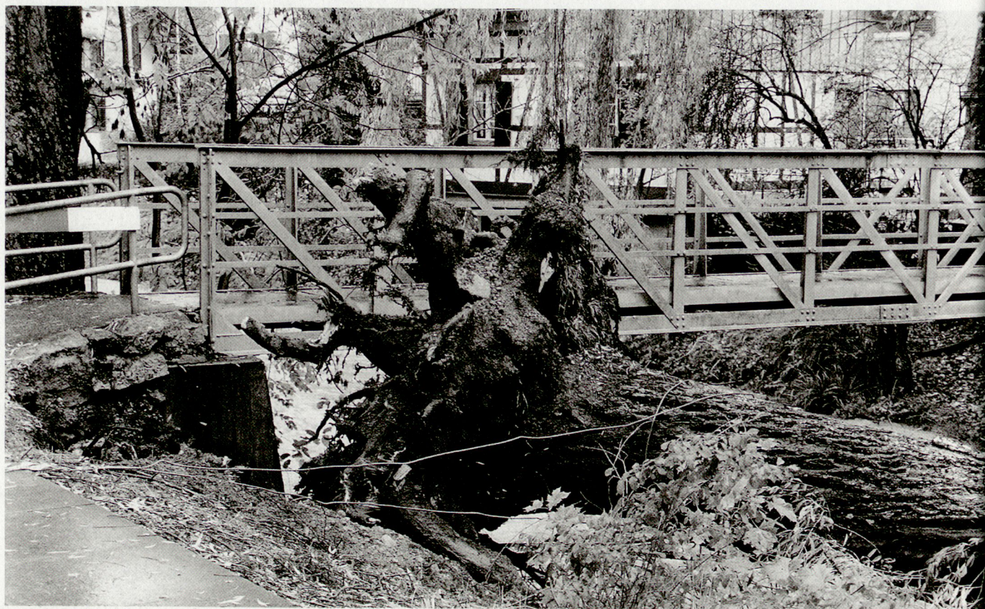
Gravierende Schäden waren auch entlang der Reppisch, hier in Dietikon, zu verzeichnen.