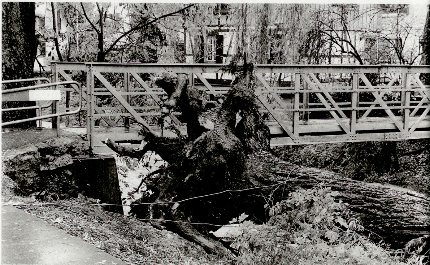
Gravierende Schäden waren auch entlang der Reppisch, hier in Dietikon, zu verzeichnen.