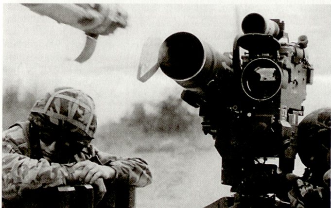
Grünes Licht für die Beschaffung der PAL «Trigat» (PARS-3-MR) für die britische Armee.

Grossbritannien will vorerst die neuen Scharfschützengewehre vom Typ L96 den Schnellen Eingreiftruppen zukommen lassen. Vorgesehen ist die Verwendung eines Gewehres mit dem leistungsstarken Kaliber .338 Lapua Magnum, das eine maximale Reichweite von über 1000 m ermöglichen soll. Die verwendete Version ist mit einem Zielfernrohr 6x42 versehen, allerdings können jederzeit andere Optiken oder auch Nachtsichtgeräte angebracht werden. Das Scharfschützengewehr L96 besitzt einen längs geteilten Kunststoffschäft mit integriertem Zweibein. Zur Verminderung des Aufstiegs der Waffe bei der Schussabgabe ist eine asymmetrische Mündungsbremse vorhanden. hg