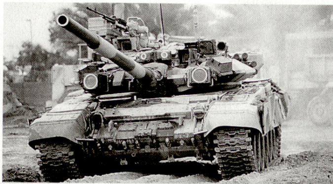
Neueste Version des russischen Kampfpanzers T-90.

inkl. Stealth-Typen sowie auch gegen ballistische Lenkwaffen) einsetzbar sein. Das System S-400 verfügt über die beiden Flugkörpertypen 9M96E und 9M96E2, die aus den mit vier Abschussrohren bestückten Abschussfahrzeugen eingesetzt werden können. Der weiter verbesserte Lenkwaffentyp des Systems S-400 hat gemäss Herstellerinformationen eine maximale Reichweite von 120 km und soll Luftziele bis in eine Höhe von 30 km bekämpfen können. Gemäss russischen Angaben sollen die ersten Lieferungen an die eigene Luftwaffe Russlands, in die unterdessen auch die früher selbständigen Luftverteidigungskräfte integriert worden sind, gegen Ende 1999 beginnen. Zudem erhofft sich natürlich die russische Rüstungsindustrie Verkaufsmöglichkeiten für dieses Abwehrsystem, das auf dem internationalen Waffenmarkt als grosser Konkurrent zur amerikanischen «Patriot» angesehen werden muss. hg