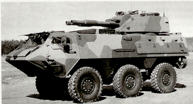
Mobiler Zwillingminenwerfer XA-185 AMOS, eine Entwicklung der finnischen Rüstungsindustrie.