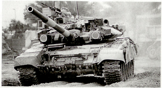
Neuste Version des russischen Kampfpanzers T-90.

inkl. Stealth-Typen sowie auch gegen ballistische Lenkwaffen) einsetzbar sein. Das System S-400 verfügt über die beiden Flugkörpertypen 9M96E und 9M96E2, die aus den mit vier Abschussrohren bestückten Abschussfahrzeugen eingesetzt werden können. Der weiter verbesserte Lenkwaffentyp des Systems S-400 hat gemäss Herstellerinformationen eine maximale Reichweite von 120 km und soll Luftziele bis in eine Höhe von 30 km bekämpfen können. Gemäss russischen Angaben sollen die ersten Lieferungen an die eigene Luftwaffe Russlands, in die unterdessen auch die früher selbständigen Luftverteidigungskräfte integriert worden sind, gegen Ende 1999 beginnen. Zudem erhofft sich natürlich die russische Rüstungsindustrie Verkaufsmöglichkeiten für dieses Abwehrsystem, das auf dem internationalen Waffenmarkt als grosser Konkurrent zur amerikanischen «Patriot» angesehen werden muss. hg