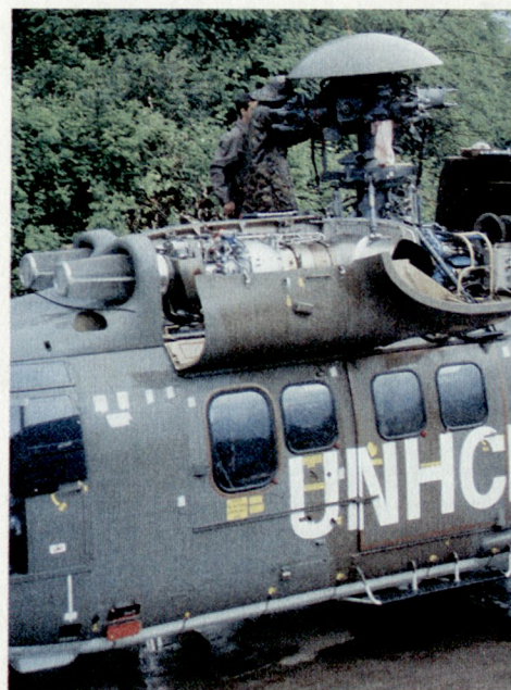
Rotorblattwechsel bei strömendem Regen.