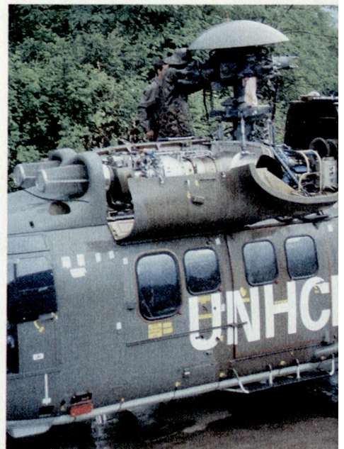
Rotorblattwechsel bei strömendem Regen.