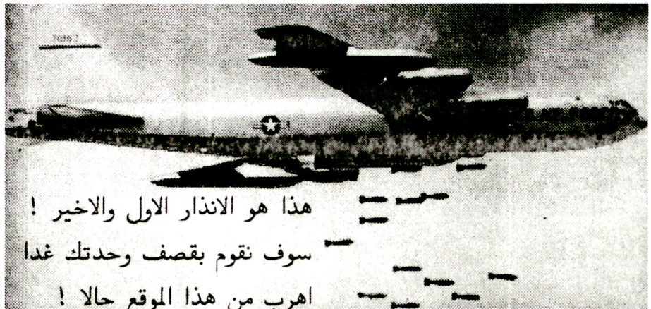
Flugblatt aus dem Golfkrieg 1991: «Die 16. Infanterie-Division wird morgen bombardiert. Verlasse diesen Ort sofort und rette dein Leben!»

Obwohl technisch die Möglichkeiten zur Desinformation und arglistigen Täuschung bestünden, darf die amerikanische Psy Op diese Mittel nicht einsetzen. Nicht verpflichtet ist Psy Op der