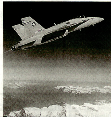
Der F/A-18 fliegt heute in der Schweiz nicht zuletzt dank starker Überzeugungsarbeit der Milizverbände. ■

Das Militär verändert sich, die Einstellung des Volkes zur Landesverteidigung verändert sich. Die sicherheitspolitischen Herausforderungen der Zukunft sind gross. Wir brauchen eine glaubwürdige Landesverteidigung. Diese gilt es auch in den kommenden militärfeindlichen Initiativen, die anstehen, durchzusetzen. Dank der Unterstützung der militärischen Vereine war dies in der Vergangenheit möglich. Jetzt heisst es, sich auf die Zukunft vorzubereiten, sich zu organisieren und die Kräfte zu konzentrieren. Dazu brauchen wir die Milizinstitutionen, als gelebte Miliz. Das Milizsystem ist die Basis unserer Demokratie. Wir werden dies aber nur erhalten können, wenn wir unser Milizsystem verwesentlichen. Jeder in seinem Verein, jeder in seiner politischen Partei. Das bekannte Sprichwort muss angepasst werden. «Es gibt nichts Gutes, ausser wir tun es.»