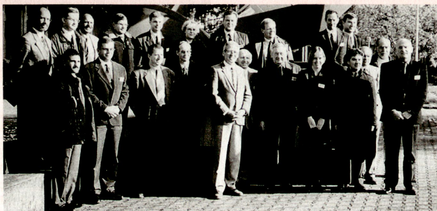
Gruppenbild der Teilnehmer.

Vom 29. bis 31. Oktober 1997 fand im AC-Laboratorium Spiez (ACLS) ein internationaler NATO-Workshop zur Umsetzung des Chemiewaffen-Übereinkommens (CWÜ) statt. Mit dem Beitritt zum NATO-Programm «Partnerschaft für den Frieden» (Partnership for Peace, PfP) im Dezember 1996 bezeugte die Schweiz ihr Interesse, einen aktiven Beitrag zur Erhaltung des Weltfriedens zu leisten. Für PfP-Projekte arbeiten in der Schweiz Bundesstellen verschiedener Departemente, so auch das ACLS, welches mit diesem Workshop einmal mehr sein breites Wissen und seine grosse Erfahrung als Fachstelle der Gruppe Rüstung der Öffentlichkeit zur Verfügung stellen konnte. Nicht nur fachlich, sondern auch örtlich und hinsichtlich Infrastruktur ist das AC-Zentrum Spiez der geeignete Ort, eine solche Veranstaltung abzuhalten. Sämtliche 20 Teilnehmer/innen (militärisch und zivil) aus 14 Staaten (Belgien, Bulgarien, Dänemark, Deutschland, Estland, Finnland, Italien, Österreich, Polen, Schweden, Tschechien, Ukraine, Ungarn, USA) waren in der AC-Ausbildungsstätte untergebracht.