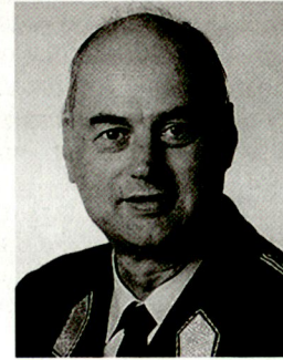
Dipl. Ing. Günther Greindl, Divisionär, Leiter der Generalstabsgruppe «Militärpolitik und Sicherheitskooperation» im österreichischen Bundesheer.

Vom Oktober 1993 bis April 1994 leitete ich auf Ersuchen des Generalsekretärs der Vereinten Nationen eine Sonderuntersuchungskommission betreffend die United Nations Protection Force in the former Yugoslavia (UNPROFOR) und nahm die Funktion