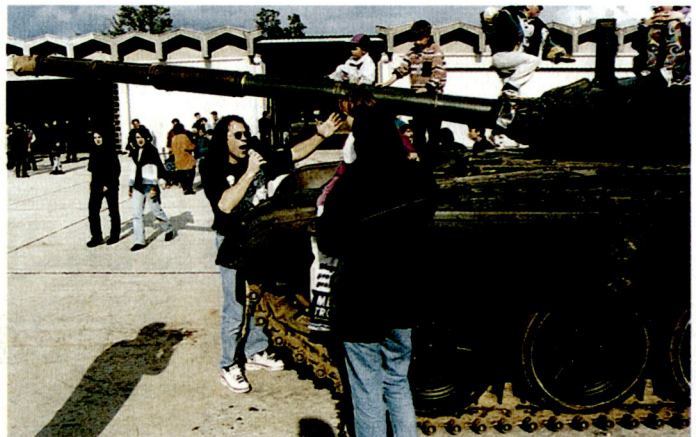
Am «Tag der offenen Türe» setzt die Armee auch auf einheimische Schlagerstars als Publikumsmagnet.