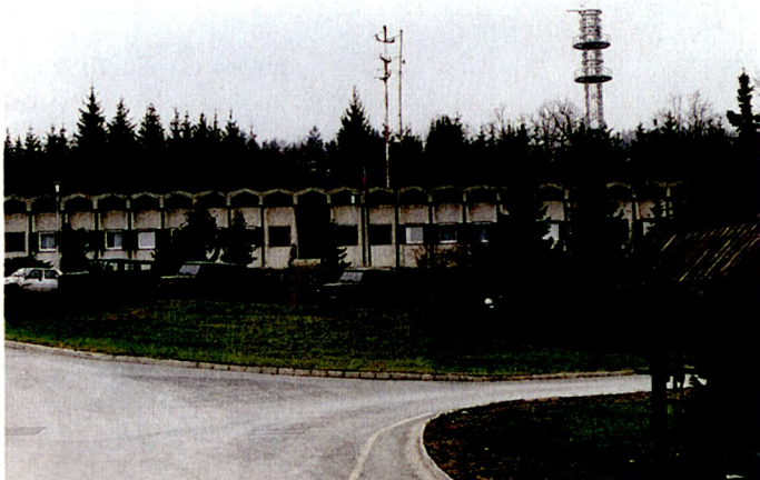
Die slowenische Kaserne «Ivan Cankar» in Vrhnika.