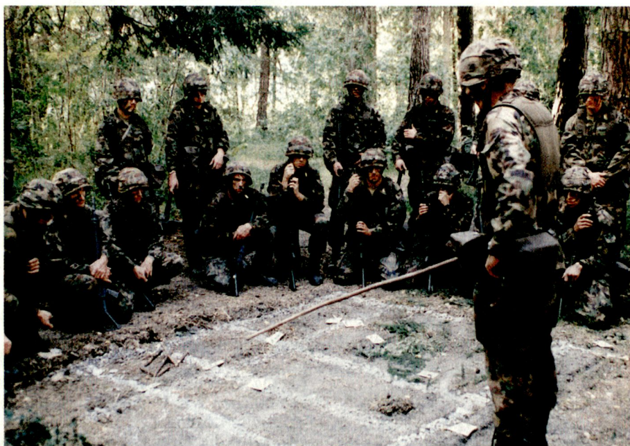
Der Grenadier-Zugführer befiehlt den Zugseinsatz dem ganzen Zug am Geländemodell.

Der junge Soldat aller Stufen rückt mit einer bemerkenswert guten Motivation in den Dienst ein. Er will gefordert werden. Deshalb, in erster Linie aber um der Sache willen, sind ihm Armee und Kader schuldig, optimale Rahmenbedingungen für die Ausbildung zu schaffen. Bevor dies erreicht ist, liegt immenses menschliches Kapital brach. Die vorstehenden Zeilen tragen hoffentlich zur Verbesserung der Rahmenbedingungen bei. Die Zeit des Umbruchs bietet in diesem Sinne grosse Möglichkeiten. Im herrschenden politischen Umfeld liegt es vor allem bei der Armeeführung, diese Chancen tatkräftig anzupacken. Wir hoffen darauf!