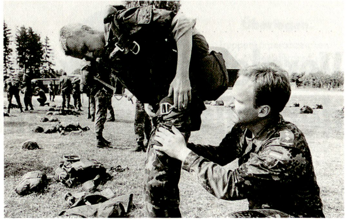
Manchmal ergibt sich die Möglichkeit, ausländisches Material auszuprobieren. Schweizer Para beim Ausrüsten.

spät. Da sich in den letzten Jahren aber ein sehr gutes und persönliches Beziehungsnetz mit den Veranstaltern gebildet hat, erhält heute das Kdo die Ausschreibung zusätzlich zum offiziellen auch auf dem «kleinen Dienstweg». Dies ermöglicht eine bessere zeitliche Vorbereitung.