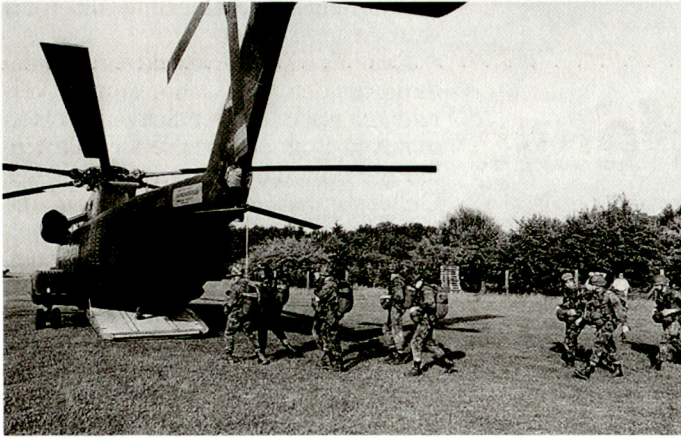
Wettkämpfer auf dem Weg zum Hubschrauber (CH-53 G) der Bundeswehr.