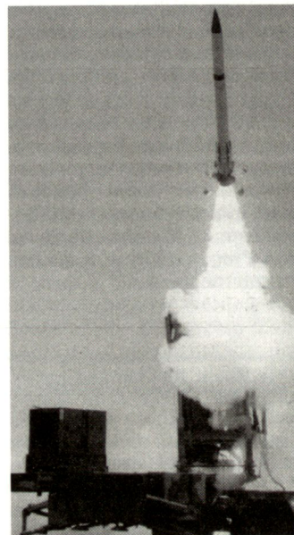
Abschuss einer Boden-Luft-Lenkwafe «Patriot».