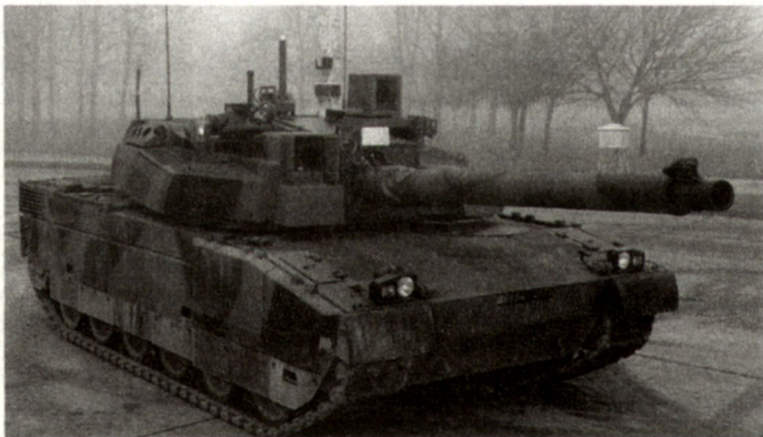
Kampfpanzer LeClerc mit BIFF-System.

Bezüglich Beschaffung eines BIFF-Systems will Frankreich das laufende multinationale Evaluationsverfahren, an dem diverse westeuropäische Armeen beteiligt sind, abwarten. hg