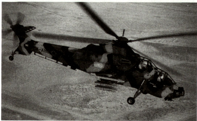
Südafrikanischer Kampf-helikopter «Rooivalk».

Unterdessen hat das südafrikanische Parlament einen Verkauf von Kriegsmaterial an die Türkei aus politischen Gründen (Verletzung der Menschenrechte in der Türkei, Besetzung von Nordzypern) abgelehnt. Gemäss Insiderberichten hätte der CSH-2 «Rooivalk» gute Chancen gehabt, berücksichtigt zu werden. Aufträge für diesen Kampf-helikopter liegen bereits von den eigenen südafrikanischen Streitkräften und von Malaysia vor. Ungewiss dürfte auch eine allfällige Entscheidung des US-Kongresses sein, falls ein amerikanischer Typ berücksichtigt würde. Aus diesen Gründen dürften die Typen «Mangusta», «Tiger» und Mi-28 am meisten Chancen haben, bei der bevorstehenden Evaluation berücksichtigt zu werden. Der Typenentscheid soll im Verlaufe des Jahres 1998 gefällt werden. hg