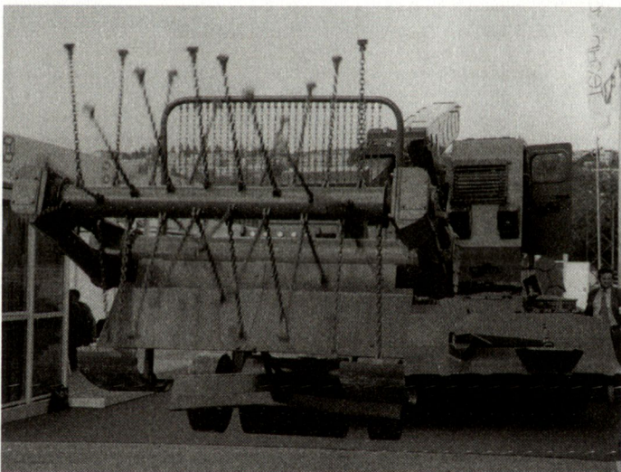
Minenräumpanzer UOS-155 «Belarty».

tel in diesem Bereich völlig unzureichend sind. Ausgehend von dieser Negativbilanz verlangten sowohl die UNO als auch andere Organisationen eine Verbesserung der Minenaufklärung und Minenräumtechnik.