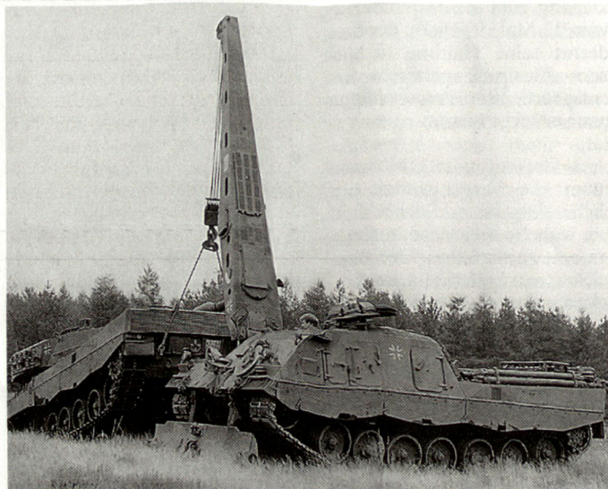
Bergepanzer 3 «Büffel» im Einsatz bei der deutschen Bundeswehr.

Die neuen Verhandlungen haben zum Ziel, weitere 12 «Patriot» im Jahre 2005 in das Eigentum der Deutschen zu überführen. Die Bundeswehr bemannte nicht nur die «Patriot»-Systeme, sondern beschaffte 27 «Roland»-Raketensysteme, mit denen mit deutschem Personal amerikanische Militärbasen im Nahbereich geschützt werden können. Die Aufstellung einer deutsch-amerikanischen Luftverteidigungsbrigade steht im engen Zusammenhang mit der Vertragsverlängerung. Über die reine Verteidigungsfunktion hinaus hat sie Modellcharakter für eine breit angelegte transatlantische Partnerschaft. Tp.