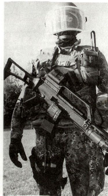
Deutscher Soldat mit dem neuen Sturmgeschütz G-36 und verbesserter persönlicher Ausrüstung.

Zusätzlich werden die deutschen Soldaten in den nächsten Monaten mit einem leichten Fleckentarnanzug sowie mit neuen Aramid-Helmen, die aus besonders hartem Kunststoff gefertigt sind und mit einem Augenschutz versehen sind, ausgerüstet. Von Fall zu Fall kommen andere neue Ausrüstungs-