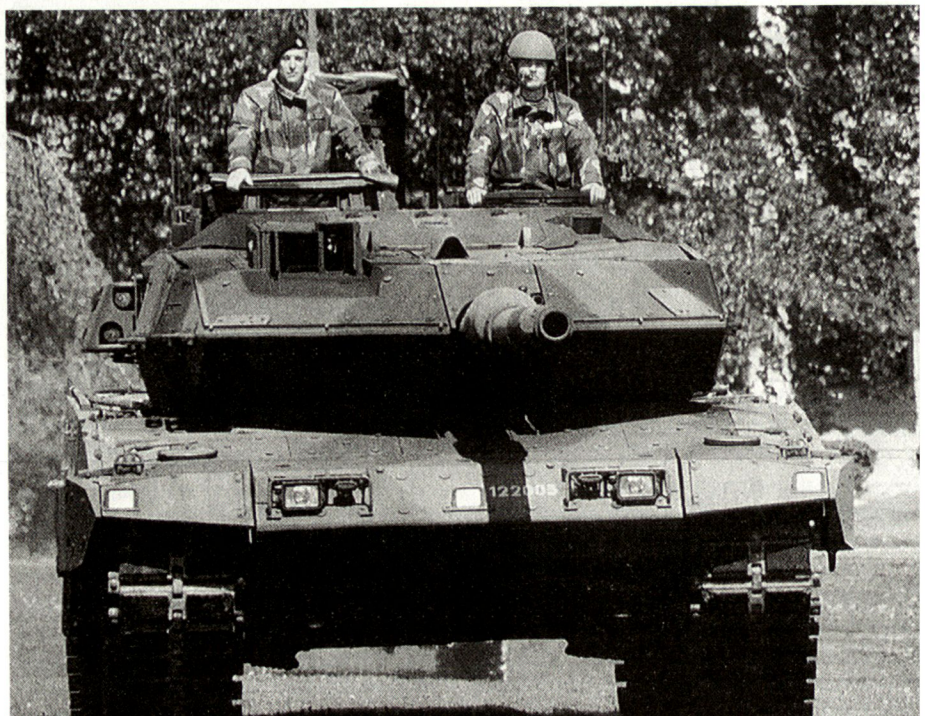
Das Heer hat die ersten von 160 neuen Leopard 2 bekommen.

– unser Territorium zu verteidigen; – die Existenz unserer Zivilisten zu schützen.