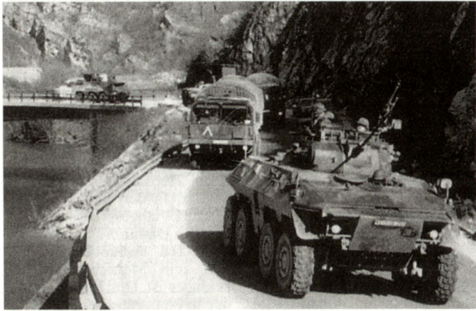
Deutsche KRK in Bosnien-Herzegowina.

chen Version vor allem bezüglich Schutz und Bewaffnung verbessert werden soll.