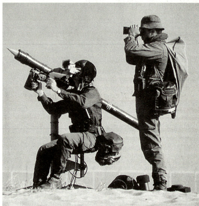
Taktische Flab-Lenk Waffe «Mistral».

Mit dieser für die ungarische Fliegerabwehr dringenden Beschaffung hat Ungarn ein deutliches Zeichen in Richtung NATO-Kompatibilität gesetzt. In den nächsten Jahren dürften – allerdings nur im Rahmen der weiterhin eingeschränkten Beschaffungsmittel – weitere westliche Waffenbeschaffungen erfolgen. hg