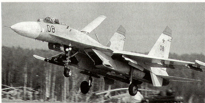
Russisches Kampfflugzeug Su-27.

sche Verteidigungsministerium in den nächsten Monaten den Auftrag für eine Modernisierung der Avionik bei 39 Kampfflugzeugen F-4 «Phantom» erteilen. Gute Chancen für diesen Kampfwertsteigerungsauftrag sollen die deutschen Daimler-Benz-Aerospace-Werke besitzen. Der griechische Evaluationsausschuss soll das Angebot der DASA offenbar der Offerte der amerikanischen Boeing vorgezogen haben. Gleichzeitig soll in den nächsten Monaten bei der landeseigenen «Hellenic Aerospace Industry» eine strukturelle Überholung von 70 Kampfflugzeugen F-4 – zwecks Verlängerung der Einsatzfähigkeit – stattfinden. Geplant ist eine Nutzung der F-4-Flugzeuge in der griechischen Luftwaffe bis zum Jahre 2015. hg