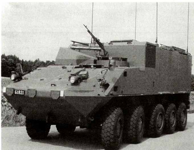
Kommandoschützenpanzer Piranha III (10×10).

führt. Von wesentlicher Bedeutung sind die angebrachten Schutzverbesserungen, die beim Fahrzeug ein Mehrgewicht von nahezu 10 t verursacht haben. Nebst der Integration von passiven und reaktiven Zusatzpanzerungen ist auch der individuelle AC-Schutz für die gesamte transportierte Mannschaft verbessert worden. Grundsätzlich sollen diese Spezial-Schützenpanzer gegen alle – in den aktuellen Krisenregionen zum Einsatz kommenden Waffen – geschützt sein. Bt.