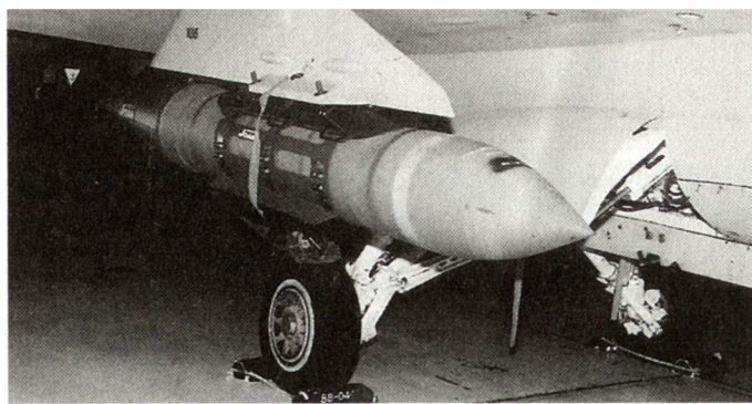
Joint Direct Attack Munition (JDAM): Soll die Präzision der fast 100000 existierenden Freifallbomben entscheidend verbessern.

ten sowie die IIR- (Imaging Infra-Red) und TV-Lenkaffen transparente Atmosphäre im Zielgebiet.