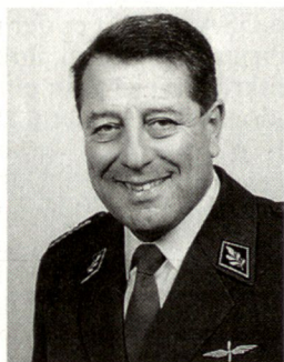
Brigadier Rudolf Läubli, zugeteilter höherer Stabs-offizier des Kommandanten Luftwaffe und Kommandant Stellvertreter der Stabs- und Kommandanten-schulen, Armee-Ausbildungszentrum, 6000 Luzern.

RAH-66 COMANCHE: Kampfhelikopter mit Stealth-Eigen-schaften.