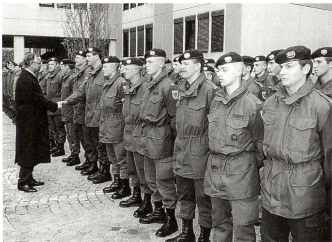
Verabschiedung des Österreichkontingents nach Albanien.

Weise sollen möglichst wenig konfliktauslösende Momente geschaffen werden. Derzeit übernimmt die Schutztruppe nur die Sicherung von humanitären Transporten, Lebensmittellieferungen und einigen Verkehrsrouten.