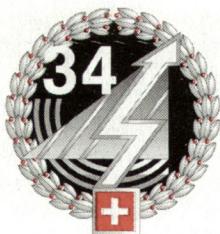
Konzept der TTK in der Informatikbrigade 34.