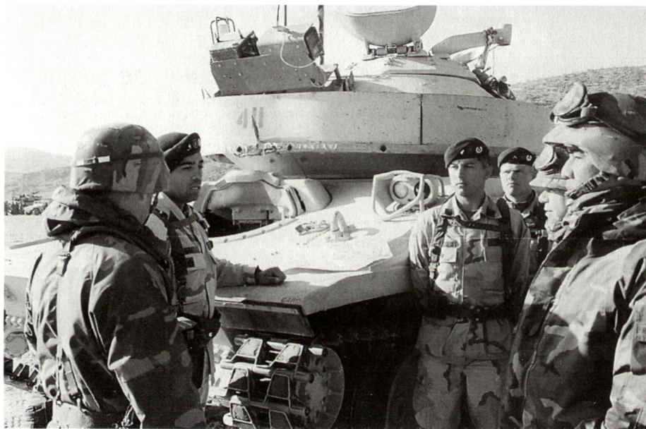
Besuch des «National Training Center» in Fort Irvin (Kalifornien): Studenten des National War College im Gespräch mit der Besatzung eines M551-«Sheridan»-Kampffahrzeuges.

Vormittags führen Vorlesungen namhafter Referenten aus Politik, Militär oder Wirtschaft in die einzelnen Themen der Kurse ein. Vierzehn Seminargruppen von je zwölf bis dreizehn Studenten (darunter je ein Ausländer) behandeln anschliessend den Stoff vertieft, wobei oft Gäste zugegen sind. Nur wenige Vorlesungen sind aus Klassifikationsgründen für Ausländer nicht zugänglich.