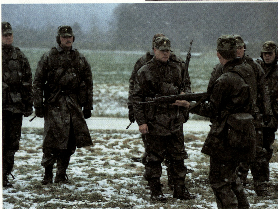
Als Soldat bemüht sich der Instruktor täglich, ein Vorbild zu sein für die übrigen Angehörigen der Armee: Abb. Schiessausbildung beim Infanterie-Ausbildungszentrum Walenstadt.