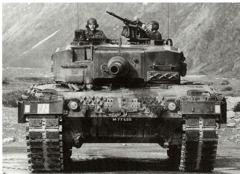
Char de combat Léopard 2.

L'étendue du secteur de mouvement opératif, la complexité de la recherche des informations et des connaissances relatives aux intentions de l'adversaire obligent les services de renseignements à une collaboration étroite avec l'échelon supérieur. Comme cela se fait pour les commandants subordonnés il s'agit d'intégrer le sous-chef d'état-major renseignements ou l'officier renseignements dirigeant, dans la planification d'emploi du corps d'armée. Ceci, tout particulièrement, pour toutes les mis-