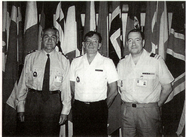
Mitte: Präsident C.I.O.R., rechts: Generalsekretär C.I.O.R.

Die Schweizerische Offiziersgesellschaft ist Mitglied der «Confédération Interalliée des Officiers de Réserve (C.I.O.R.)».