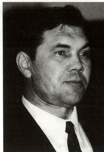
Alexander Lebed, Ex-Sicherheitsberater von Präsident Boris Jelzin und Ex-Sekretär des Russischen Sicherheitsrates.

Der Krieg in Tschetschenien hat uns gezeigt, dass Russland nicht mehr über eine gut ausgebildete Armee verfügt. Offiziere wurden aus der Armee entlassen, und das Verteidigungsbudget ist