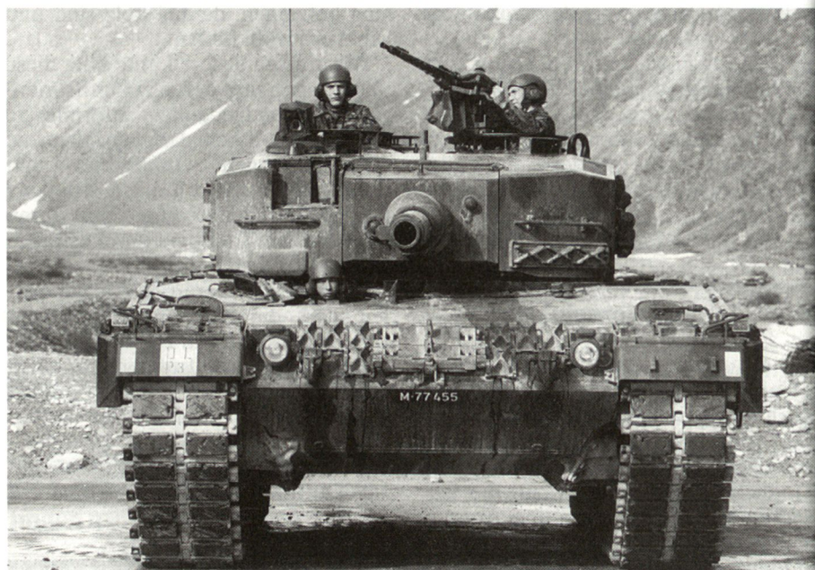
Die Angehörigen der Mechanisierten und Leichten Truppen haben weiterhin allen Grund, auf «ihre» Waffengattung stolz zu sein. Abb. Ausbildung am Kampfpanzer Leopard 2.

Im Jahr 1996 geht es darum, diese neuen Strukturen und Führungsabläufe einzuspielen, Schnittstellen zu erkennen und die Verantwortungen und Kompetenzen endgültig zu regeln. Eine Herausforderung an alle Chefs und Mitarbeiterinnen, die als Mitspieler und nicht als Zuschauer diese Aufgabe wahrnehmen.