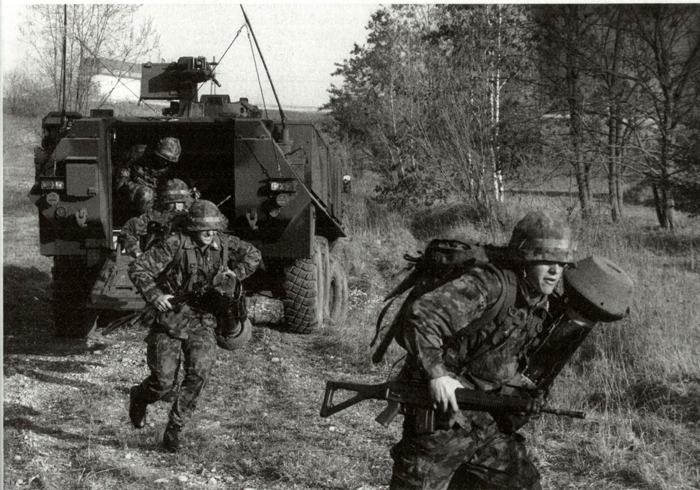
Bedenken über inskünftig fehlende Identifikation mit der Waffengattung Infanterie sind völlig unbegründet: Die Waffengattung Infanterie bleibt bestehen. Abb.: Infanteristen verlassen den Radschützenpanzer.

Um sich dieser Kernfunktion in der Ausbildung voll widmen zu können, wurden die bisherigen Aufgaben eines Bundesamtes bzw. Waffenchefs auf die Stufe des Inspektors bzw. Direktors BAKT zusammengefasst und vorwiegend der Abteilung «Koordination und Steuerung» überwiesen. Hier übernehmen die drei Sektionen «Ausbildungssteuerung», «Einsatzverfahren und Grundlagen» sowie «Ausrüstung und Vollzug» diese planerischen und doktrinen Aufgaben und entlasten bzw. unterstützen die Ausbildungsstätten