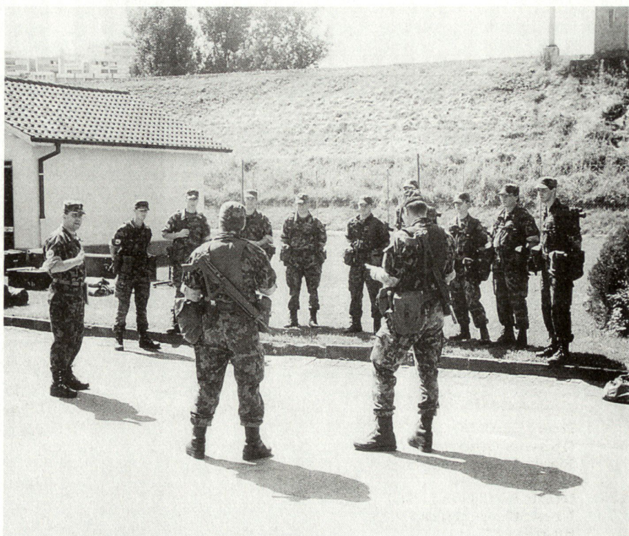
Abb.4: Klassenlehrer mit Unteroffiziersschülern.

Zu behaupten, dass alles perfekt gelungen ist, wäre vermessen. Es gibt noch einiges zu verbessern.