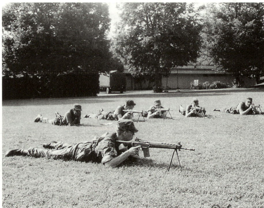
Abb. 1: Zugführer bei der praktischen Ausbildung mit dem Sturmgewehr 90.