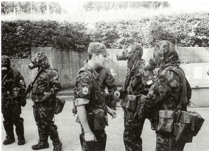
Abb.2: Zugführer beim praktischen Unterricht mit der Schutzmaske.