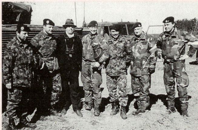
Am 15. April 1996 besuchte der Schweizerische Botschafter in Schweden, André Ramseyer, die Panzertruppenübung im Süden Schwedens. Auf dem Bild der Botschafter (3. von links) zusammen mit Instruktoressen aus der Schweiz und aus Schweden.

fältige Auswertung der Gefechtsausbildung unserer Panzertruppe zugute kommen.