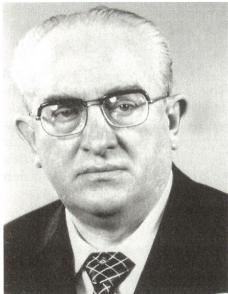
Juri Andropow, KGB-Vorsitzender von 1967 bis 1982, war 1982 bis 1984 Generalsekretär der KPdSU.

ben galt es, Misstrauen zwischen der Opposition und ihren ausländischen Supportern zu streuen und im Rahmen der externen Opposition Zwietracht zwischen den Exil-Ländern und den Oppositionellen zu sähen.