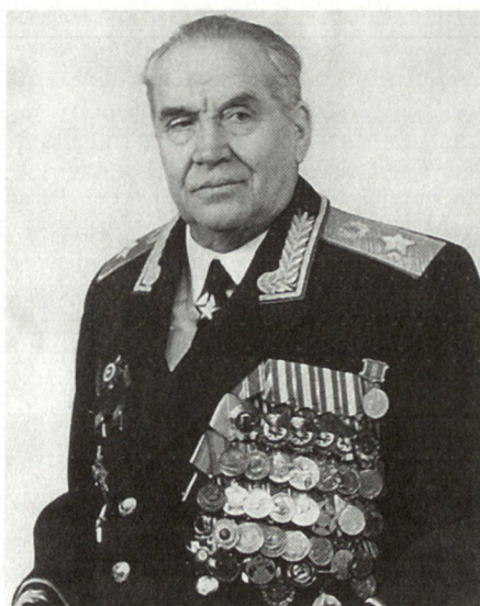
Armeegeneral Mahmut A. Garejew, ehemaliger stellvertretender sowjetischer Generalstabschef und Hauptmilitärberater des afghanischen Präsidenten Najibullah.