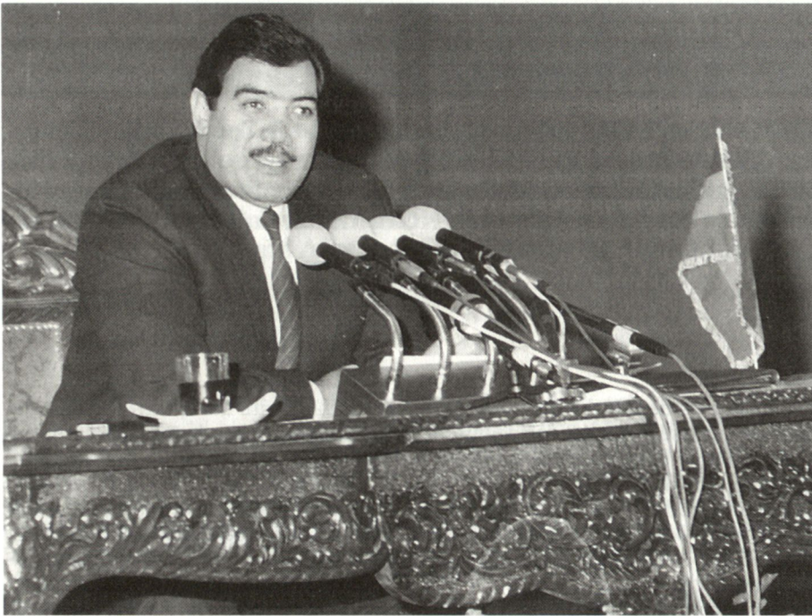
Dr. Mohammad Najibullah (Übername «Der Bulle»), Arzt, Chef des berüchtigten «KHAD» (afghanischer KGB) und prosovjeterischer kommunistischer Staatschef Afghanistans von 1987 bis 1992.

40. Armee nie den Bedürfnissen des Anti-Guerillakrieges angepasst wurden.