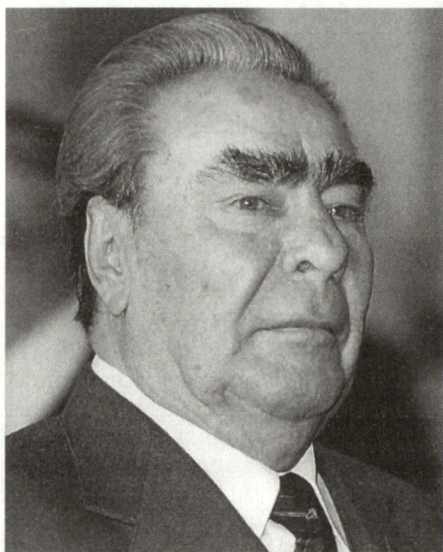
Leonid Breschnew, Generalsekretär der KPdSU von 1964 bis 1982.

Nach den Worten Garejews wurde der Einsatz der Truppen in Afghanistan durch das Fehlen klarer politischer und strategischer Ziele und Konzepte behindert. Wohl gab es Pläne für bestimmte Zeitabschnitte oder für einzelne Operationen. Aber während des gesamten Krieges hatte der Generalstab nie einen strategischen Plan für die Definition der Ziele und Aufgaben der Armee ausgearbeitet. Ziel und Auftrag des Krieges blieben deshalb den Kommandanten unklar. Dies dürfte auch einer der Gründe gewesen sein, warum Struktur und Einsatzkonzeption der