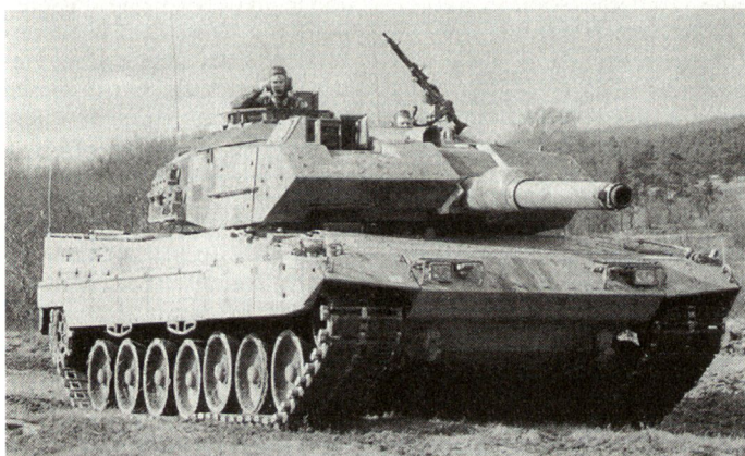
Kampfwertgesteigerter Kampfpanzer Leopard 2-A5.

Im Rahmen der «Partnerschaft für den Frieden» üben seit einiger Zeit NATO-Verbände oder -Einheiten gemeinsam mit solchen aus ehemaligen WAPA-Staaten. Das ist inzwischen fast Routine geworden. Vor allem in Grenznähe, zum Beispiel an der Grenze zwischen Deutschland und Polen, entstanden Patenschaftsverhältnisse zwischen vergleichbaren deutschen und polnischen Verbänden. Mitte Dezember übten auf dem polnischen Truppenübungsplatz bei Sagan eine Kompanie der 15. Panzergrenadierdivision aus Doberlug-Kirchhain mit einer Panzerkompanie der 11. polnischen Panzerkavalleriedivision. Die deutschen Verbände brachten Kampfpanzer «Leopard 1-A5», die Polen T-72 zum Einsatz. Bei der Trefferaufnahme stellte sich heraus, dass die Trefferausbeute der polnischen Kompanie höher lag. Hier machte sich der Unterschied zwischen Auftrags-taktik und Befehlstaktik, die auf alte russische Tradition zurückgeht, bemerkbar. Während den Deutschen nach Auftragserteilung die Ausführung weitgehend frei überlassen blieb, hat-