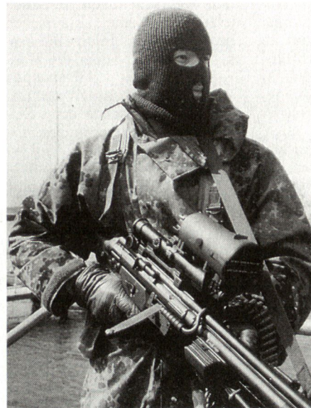
Die deutsche Bundeswehr verfügt seit 1. Januar 1996 über einen Spezialverband für Sondereinsätze.

Für den 1. Januar 1996 hat der Bundesminister der Verteidigung die Aufstellung eines neuen Spezialverbandes für den Einsatz in Notsituationen als «Kommando Spezialkräfte» befohlen. Hierdurch wird die Bundeswehr über Kräfte verfügen, mit denen sie in der Lage sein wird, insbesondere bei Krisenreaktionseinsätzen in unmittelbare Not geratene Solda-