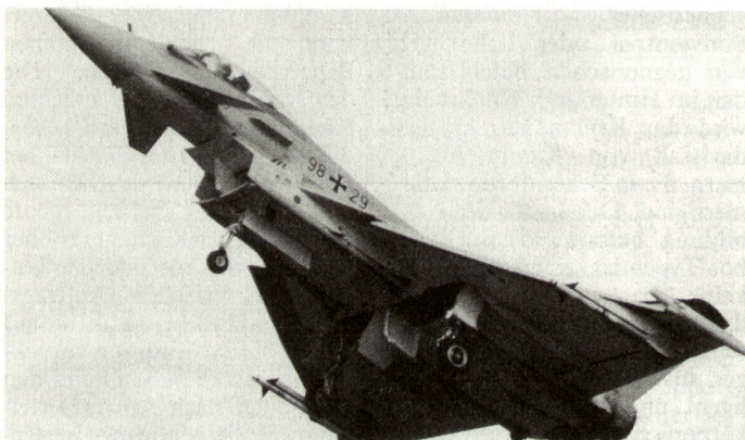
An der Beschaffung von 180 Jägern 2000 soll festgehalten werden.

Etliche wehrpolitisch tätige Verbände, an deren Spitze die österreichische Offiziersgesellschaft, forderten den Rücktritt des Innenministers. Die Realisierung seiner Vorschläge wür-