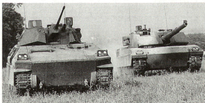
Die neuen Panzerbrigaden werden mit Kampfschützenpanzer VCC-80 (links) ausgerüstet; rechts Panzer Ariete.