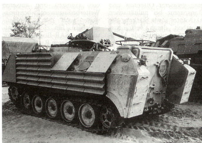
Schützenpanzer VCC-1 mit Schutzverbesserungen (Italien).

schieden, die früher mit Panzern Leopard 1 ausgerüsteten mechanisierten Kavallerie-Einheiten im Verlaufe der 90er Jahre auf moderne Rad-Kampffahrzeuge (Centauro und Puma) umzurüsten. Künftig sollen insgesamt nur noch acht dieser Kavallerie-Regimenter vorhanden sein, wobei die italienischen Krisenreaktionskräfte (wie beispielsweise heute in Ex-Jugoslawien) aus solchen Einheiten bestehen. Die Eingliederung der ebenfalls aus italienischer Produktion (Fahrzeugwerke IVECO-OTO) stammenden Rad-Kampffahrzeuge dürfte infolge Finanzierungsproblemen allerdings wesentlich verzögert werden. hg