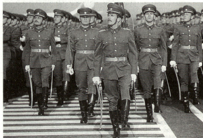
In Russland ist seit 1994 ein wieder zunehmendes Interesse an der Offizierslaufbahn festzustellen.

Der frühere starke Andrang zu den Offiziersschulen (zwei Kandidaten pro Studienplatz) hat in den Jahren 1989 bis 1993 nachgelassen wegen: Armeekritischer Einstellung in der Gesellschaft, Verschlechterung des Lebensstandards der Offiziere und der Umorientierung der moralischen Werte der Jugend. Seit 1994 hat das Interesse der Jugend zum Offiziersberuf wieder zugenommen. Dieser Stimmungswandel ist folgenden Faktoren zuzuschreiben: Wegen der Zunahme der allgemeinen Arbeitslosigkeit ist die garantierte Arbeitsvermittlung der Offiziere von grosser Bedeutung; die materielle Situation (Stipendien, Vergünstigungen) der Offiziersaspiranten ist viel besser als der Studenten ziviler Hochschulen. GB