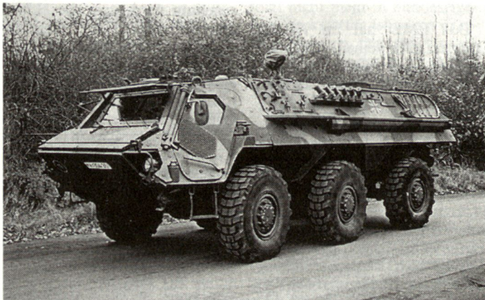
Aufklärerversion des Transportpanzers Fuchs, ausgerüstet mit modularer Zusatzpanzerung gegen Beschuss, Splitter und Minen.

Folgende Verpflichtungen, welche die Konferenz für Sicherheit und Zusammenarbeit in Europa (KSZE) festlegte, werden damit eingelöst: Förde-