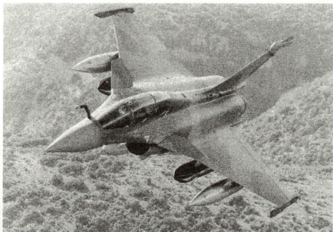
Kürzungen bei den französischen Verteidigungsausgaben dürften zu einer weiteren Reduzierung der Stückzahlen beim Mehrzweck-kampfflugzeug Rafale führen.

rekten Investitionskosten sogar um 7,8 Prozent reduziert und noch 18,9 Mia US$ betragen. Zur Durchsetzung dieser Budgetkürzungen wird auch die schon heute mit Absatzschwierigkeiten kämpfende französische Flugzeugindustrie zur Kasse gebeten. So wird der Beginn der Serienproduktion des deutsch-französischen Tiger-Kampfhubschraubers von Eurocopter um ein weiteres Jahr hinausgezögert. Ebenfalls das