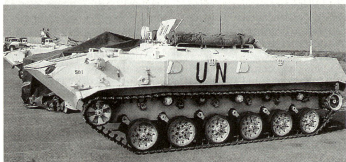
Modifizierte Version des Luftlandepanzers BMD (Russland).

Die geeigneten Mittel für all diese Einsatzfälle sind gepanzerte Radschützenpanzer, da man sich im allgemeinen nicht abseits von Strassen bewegt und erhöhter Panzerschutz nicht vonnöten ist. Radfahrzeuge sind schneller als Raupenschützenpanzer, autonomer und bequemer für die transportierte Mannschaft, benötigen weniger Unterhalt und sind verlässlicher. Die Versionen 6×6 und 8×8 sind schwerer zu immobilisieren und weniger sensibel auf Panzermijnenexplosionen. Ein Schutz gegen Projektil 12,7 mm und Hohlladungsgeschosse, Granaten und Raketenrohre des Typs RPG-7 genügt. Er kann durch Zusatzpanzerung hergestellt werden. Die Mannschaft und der Motorenraum müssen unbedingt gegen Feuer und Anschläge geschützt werden. Im überbauten Gebiet muss der Maschinengewehrturm auf jeden Fall geschlossen sein (Mg mindestens vom Kaliber 12,7 mm ergänzt durch Granatwerfer 40 mm). Diese Waffe muss weit nach oben wirken können (oberste Stockwerke, Höhenstellungen) und mit einer Nachtsichtvorrichtung gekoppelt sein. Die Schiessscharten an den Seiten des Fahrzeuges müssen so beschaffen sein, dass der Schütze bei der Schussabgabe nach aussen hin geschützt ist. Angezeigt ist auch die Verwendung von Nebelwerfern, Trä-