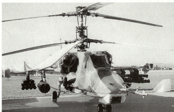
Kampfhelikopter Ka-50 wurde von der russischen Exportagentur Rosvooruzhenie auch an der Rüstungsausstellung IDEF in Ankara gezeigt.

In den letzten Monaten wurden sowohl der Mi-28 als auch der Ka-50 in diversen Ländern, die sich für eine Einführung von Kampfhelikoptern interessieren, entweder präsentiert oder teilweise auch intensiven Truppenversuchen unterzogen. Darunter befinden sich auch die schwedischen Streitkräfte, die im Jahre 1995 erste Abklärungen mit den Typen AH-64 Apache (USA) und dem russischen Mi-28 durchgeführt hatten. Denn Schweden beabsichtigt, in den nächsten Jahren allenfalls zur Unterstützung der neu ausgerüsteten mechanisierten Kräfte, eine kleine Anzahl von Kampfhelikoptern anzuschaffen. Über die Resultate der