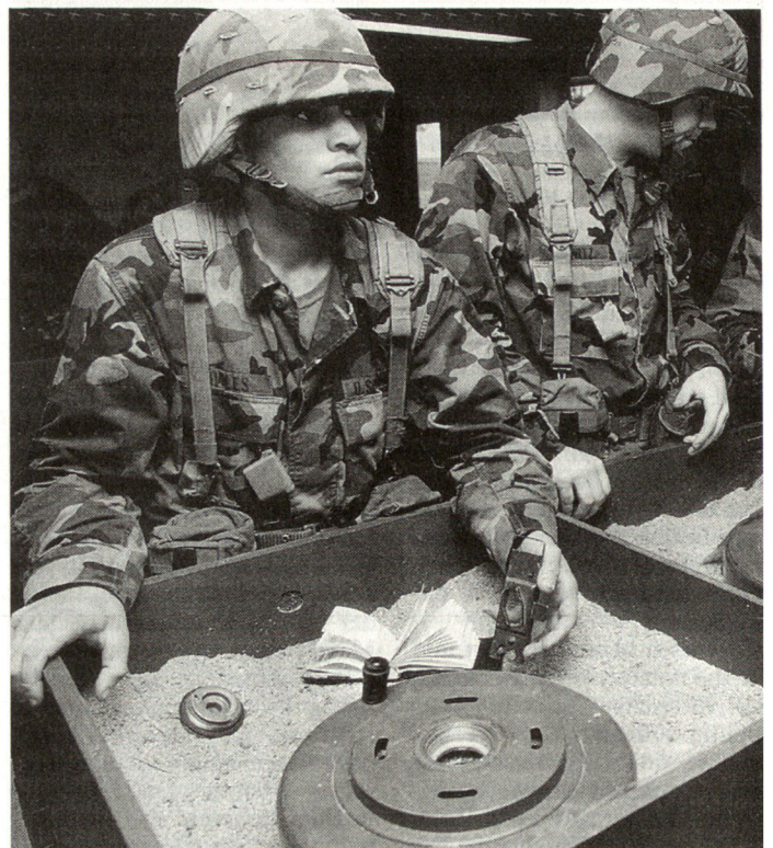
Schwerpunkt der vorgängigen Spezialausbildung bildete die Minenidentifikation und -entschärfung.