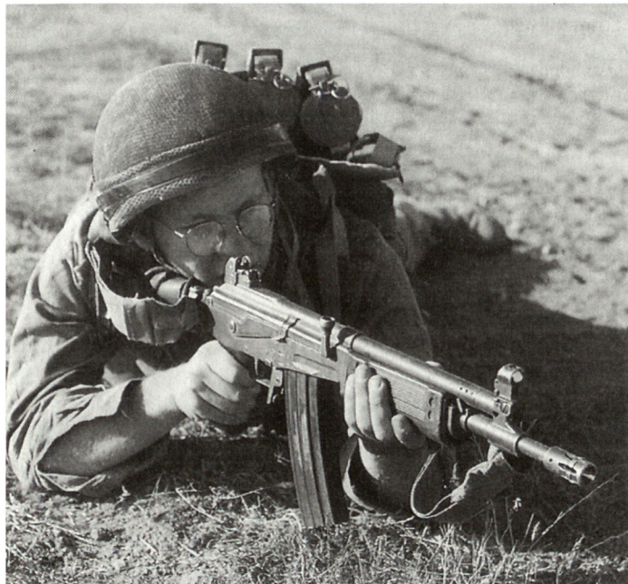
Bei der vorgesehenen Modernisierung der israelischen Infanterie soll auch das legendäre Sturmgewehr GALIL abgelöst werden.

Die Helikopterflotte, die bisher der Luftwaffe unterstand, wird neu dem Heer zugeordnet. Der Satellit OFEK überwacht vollautomatisch die Nachbarländer mittels Hochauflösungssensoren und der Erfassung elektromagnetischer Ausstrahlungen.