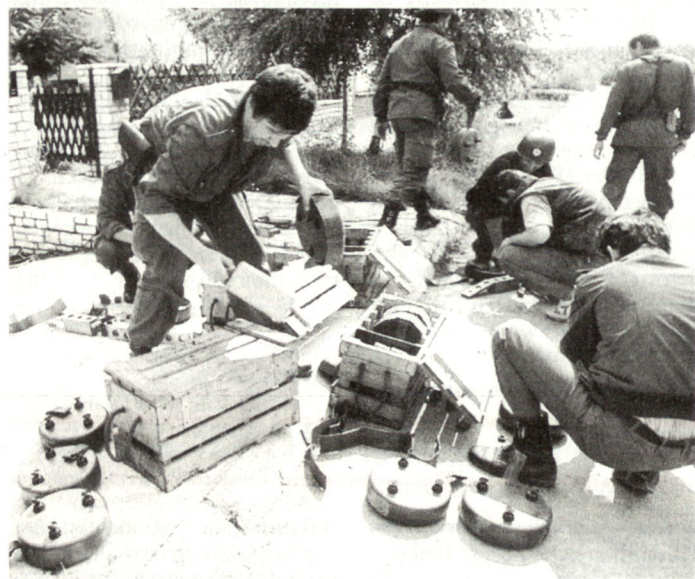
Im Verlaufe des Jugoslawienkonfliktes wurden in den Kriegsgebieten in Kroatien und Bosnien-Herzegowina einige Millionen Minen, meist unkontrolliert und ohne Verlegetpläne, eingesetzt.

len. Hauptprobleme bei den nun anlaufenden Aktionen zur Räumung dieser Kampfmittel bilden die meist fehlenden Angaben zu den grösstenteils unsystematisch angelegten Minensperren. Dazu kommt, dass ein bedeutender Teil der rund 40 bisher erkannten Minentypen (Panzerabwehr- und Personenminen) aus Plastik hergestellt ist und daher mit den herkömmlichen Metalldetektoren nicht auffindbar sind. Praktisch alle