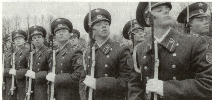
In den militärischen Lehranstalten der russischen Streitkräfte hat sich bis heute nur wenig geändert.