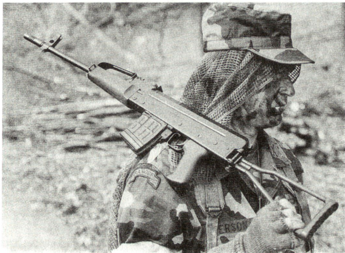
Neue Generation von tschechischen Infanteriewaffen, die auch im NATO-Kaliber 5,56 mm angeboten werden.

Zusammenfassend kann festgehalten werden, dass in praktisch allen Armeen keine Grundlagen über den Artilleriebeschuss von Städten und Ortschaften existieren. Diese dürften für solche «Terror-schiessen», wie sie in den dargestellten Beispielen erfolgt sind, keine Bedeutung spielen. Als geeignetste Munition sollen sich grosskalibrige Spreng-Granaten mit Momentan-Verzögerungszündern herausgestellt haben. Dabei sind Sekundärwirkungen wie Splitter und herumfliegende Trümmer unwesentlich. Zudem