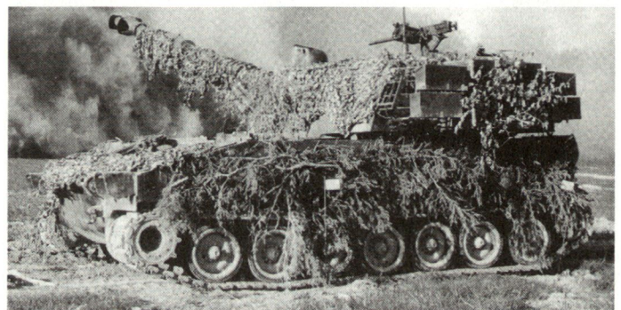
Panzerhaubitze M-109 des österreichischen Bundesheeres.

– Kampfwertsteigerung der im letzten Jahr von der britischen Armee beschafften Panzerhaubitzen M-109, die unterdessen bereits angelaufen ist.