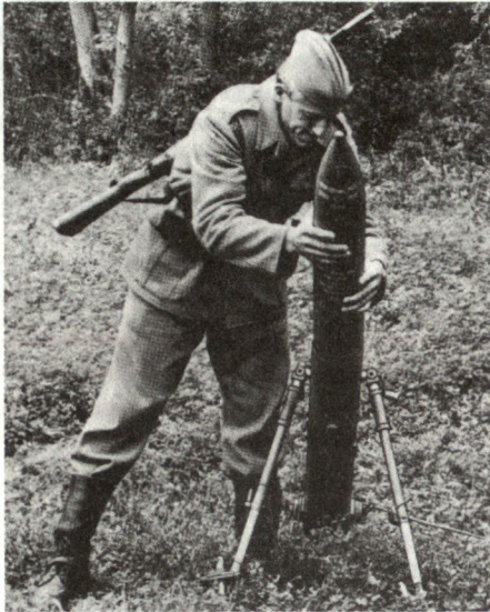
Bei den serbischen Truppen in Ex-Jugoslawien stehen auch improvisierte Feuer-mittel (Bild: Rakete 128 mm) im Einsatz.

ist festzuhalten, dass die durch das «Terror-schiessen» verursachten Trümmerfelder in der Stadt die Position des Verteidigers sogar verstärken können. Der militärische Nutzen solcher