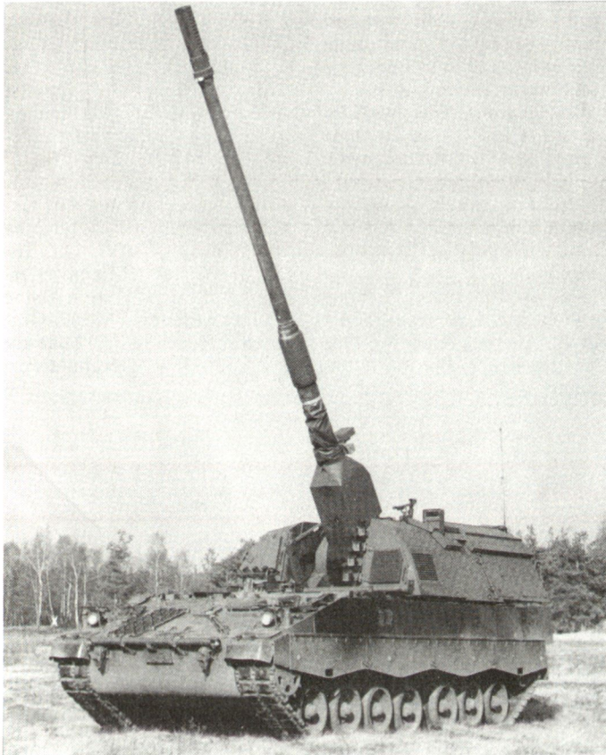
Die für die deutsche Bundeswehr vorgesehene Panzerhaubitze 155 mm PzH 2000 ist für das Verschiessen der intelligenten Munition SMART vorgesehen.