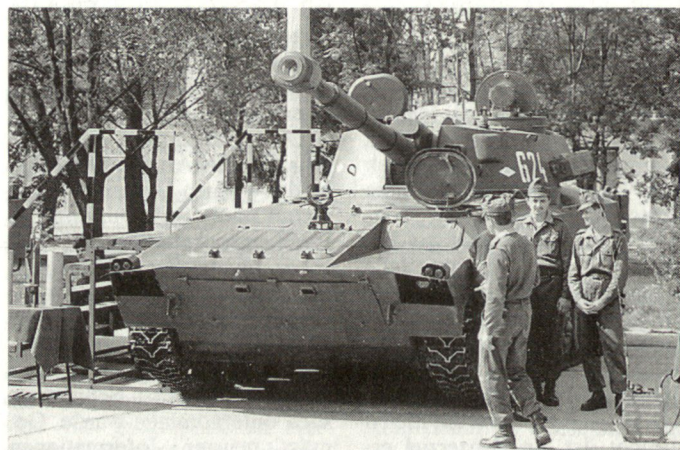
Die Situation innerhalb der Honvéd-Armee hat sich in letzter Zeit stark verschlechtert. (Bild: Ungarische Pz Haubitze 122 mm 2S1).