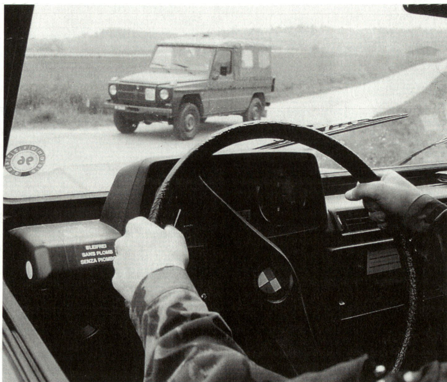
Transportformationen sind ohne wesentliche Einschränkungen auch für Existenzsicherungsaufgaben geeignet. Im Bild: Ausbildung an PUCH-Geländefahrzeugen bei den Transportformationen.