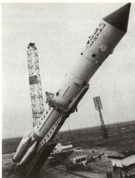
Startvorbereitungen einer russischen Proton-Rakete

mittels Proton-Raketen in die Umlaufbahn gebracht werden. Zur Frühwarnung innerhalb der Luftraumverteidigung und Raketenabwehr gehören die Typen Oke und die geostationären Prognos. Für Aufgaben der elektronischen Aufklärung sollen Satelliten der 3. und 4. Generation genutzt werden, die entweder durch Cyclon- oder Zenith-Raketen zum Einsatz gebracht werden. Die Ozean-Überwachungssatelliten der Serie Eosat wurden alle ab Baikonnur mittels der ukrainischen Cyclon-Raketen abgeschossen. Hingegen wurden die Radar-kalibrierungssatelliten ausschliesslich vom neuen Zentrum Plesetsk aus mit russischen Cosmos-Raketen (wie übrigens 60 Prozent aller militärischen Satelliten) ins All befördert.