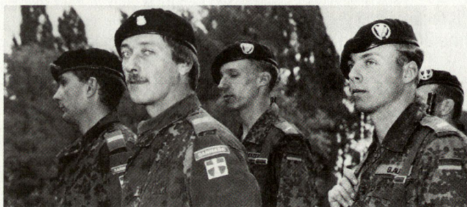
Die Bedeutung multinationaler Streitkräfte in Europa nimmt ständig zu.

– Das TADS (Target Adaptive Dispenser Weapon System) ist eine Oberflächenwaffe mit panzerbrechender Munition mit einem intelligenten Zielsuchsystem. Ein Ersteinsatz mit einem