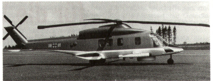
Modell der Marineversion des Helikopters NH-90, der auch für die Bundeswehr vorgesehen ist.

Die Auslegung dieses allwetterflugtauglichen Helikopters beruht auf der konsequenten Anwendung der neusten Technologien. So wird eine mehrfach gesicherte «Fly-by-wire»-