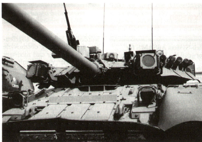
Abb.3: Modifizierter Kampfpanzer T-80UK ausgerüstet mit Lasersensoren (über Kanone) und IR-Strahlern (beidseitig Kanone).

Schussweite wird gegenüber dem früher genutzten Mg 14,5 mm praktisch verdoppelt. Im neuen Turm wird übrigens die gleiche Kanone 2A72 wie bei der BMP-Typenreihe verwendet. Erstmals ist im BTR-80A nun auch ein leistungsfähiges Nachtsichtgerät (Typ TPNS-42) eingebaut. Als Antrieb dient neuerdings ein Dieselmotor JaMS-238M.