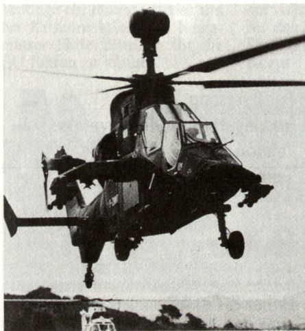
Der Kampfhelikopter Tiger von Eurocopter kämpft um Exportaufträge.

Steuerung, ein digitales Daten-pistensystem sowie eine automatische Fehlalarme integriert werden. Der dynamische Teil besteht aus Rotorblättern, gefertigt aus elastomerem Material mit einer Antriebswelle aus gehärtetem Titan; Elemente aus leichten Verbundwerkstoffen bilden den Rumpf. Eine spezielle Beschichtung wird zudem das Aufspüren durch Feindradar verringern. Bezüglich Triebwerkleistungen sind gemäss Pflichtenheft die folgenden Anforderungen festgehalten worden: Mindestens 1676 WPS für den Normalflug oder 1824 WPS Maximalleistung während einer Flugzeit von 30 Minuten. Wie beim Mehrzweckhubschrauber Westland-Agusta EH-101 werden auch die ersten Prototypen des NH-90