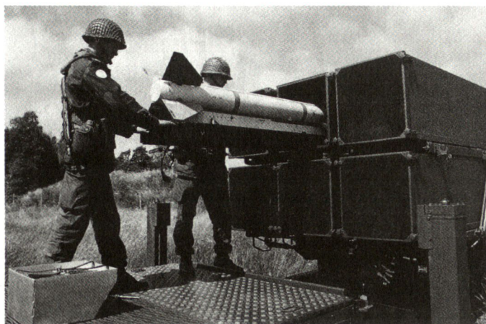
Werfer des norwegisch-amerikanischen Flab-Systems/AdSAMS, das zum Schutz von Norwegens Luftstützpunkten dienen soll.

Für die amerikanischen Spezialisten ist die Kombination AMRAAM/TPQ-36 unüber-treffbar: Die AMRAAM ist aktiv gelenkt, d. h. sie bedarf nicht der konstanten Beleuchtung des Zieles. Wenn die angreifenden Flugobjekte einmal mittels