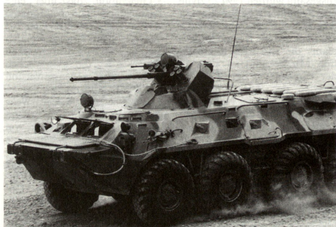
Abb.1: Radschützenpanzer BTR-80A mit Automatenkanone 30 mm.

Seit Mai 1994 steht bei der russischen Armee der neue verbesserte Schützenpanzer BTR-80A (Abb.1) in Einführung. Er soll als Transport- und Kampffahrzeug bei den mechanisierten Einheiten der Landstreitkräfte sowie bei der Marineinfanterie vorgesehen sein. Wie die neusten Einsatzbeispiele zeigen, kommt dieser Schützenpanzer auch bei den Grenztruppen und den Spezialeinheiten des Innenministeriums zum Einsatz. Beim BTR-80A handelt es sich um eine Weiterentwicklung der BTR-Schützenpanzerfamilie: Mit dem Einbau eines neuen Turmes mit Automatenkanone 30 mm wird die Kampfkraft erheblich gesteigert. Vor allem die