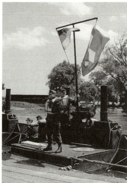
Angehörige der deutschen Pionierlehrbrigade 60.

Geht man die Sache offener an, lässt sich diskutieren. Bis zum Mai dieses Jahres sind 24 Nicht-NATO-Staaten der PfP beigetreten. Darunter Schweden, Finnland und Österreich. Darunter aber auch – besonders wichtig und nach einigem Hin und Her – Russland, obschon es sich im übrigen gegen die Ost-Erweiterung der NATO nach wie