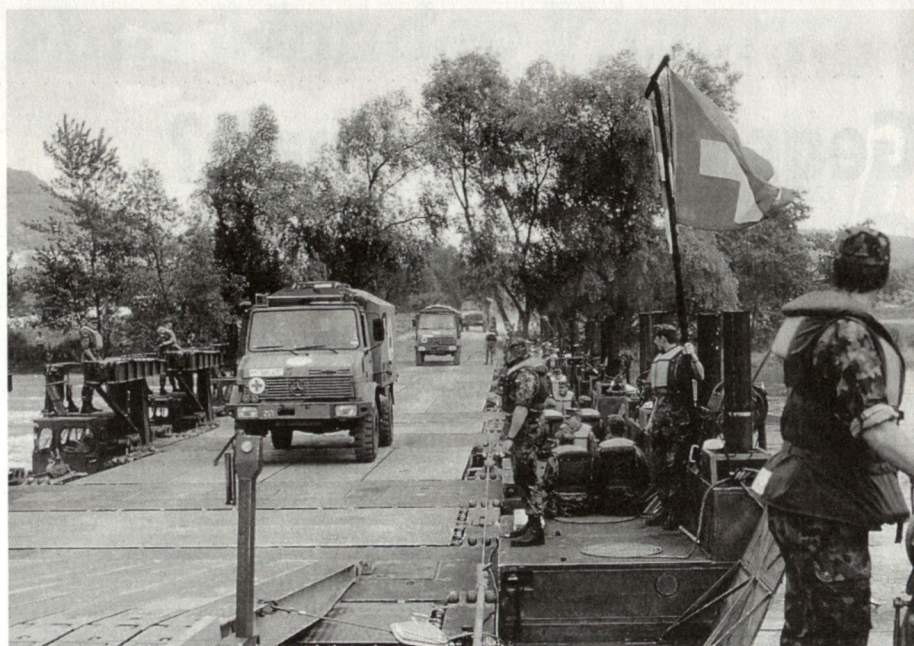
Am 27. Juni 1995 wurde von Angehörigen der deutschen Pionierlehrbrigade 60 und dem schweizerischen Pontonierbataillon 26 eine rund 150 m lange Brücke bei Zurzach über den Rhein erstellt.

Die «Partnerschaft für den Frieden» ist aber auch – und das spricht eindeutig für sie – ein Teil des notwendigen und im Aufbau begriffenen europäischen Sicherheitssystems. Früher oder später wird es Formen annehmen, und wer eine seiner tragenden Organisationen von innen kennt, der kann