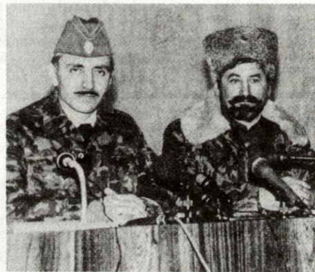
General D. Dudajew und Ataman N. Kosizin

Die Kosaken befinden sich tatsächlich in einer schwierigen Situation. Einerseits wollen sie ihrem Präsidenten treu sein, andererseits sind sie historisch und geopolitisch durch Kampfbruderschaft mit den Tschetschenen verbunden. GB ■