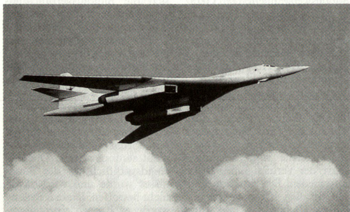
Strategischer Bomber Tu-160 BLACKJACK

In letzter Zeit präsentieren russische Munitionshersteller laufend neue Munitionstypen