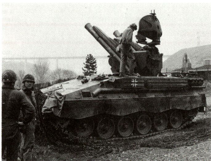
Die Bundeswehr (Bild: Flab-Lenk-Waffensystem Roland) wird in den nächsten Jahren ihre neue Struktur einnehmen.