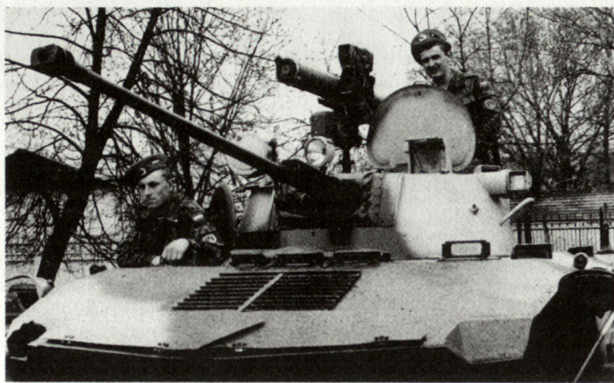
Die Situation innerhalb der russischen Streitkräfte hat sich dramatisch verschlechtert; nur die privilegierten Truppen (Bild: Luftlandetruppen mit BMD-2) sind noch einigermaßen zuverlässig.

Armee wird beeinflusst durch eine soziale Schlechterstellung, welche alle trifft. Im Oktober 1994 lag der Verdienst eines Junioroffiziers bei zirka 100 US$, derjenige eines Obersten bei rund 180$ monatlich. Dies bedeutet, dass viele Militärs an oder unter der Armutsgrenze leben müssen. Noch gibt es privilegierte Truppen, welche relativ gut leben und bei denen sich kaum Anzeichen der Frustration zeigen. Dazu gehören Teile der Krisenreaktionskräfte, die strategischen Raketenstruppen, die Weltraumtruppen sowie alle Truppen, welche Jelzin unter sein direktes Kommando gestellt hat (Grenztruppen).