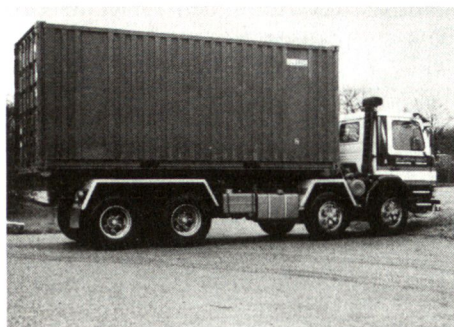
Abb. 1: Das für den Versuch eingesetzte zivile Trägerfahrzeug mit der entsprechenden Hakenabrollvorrichtung.