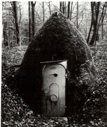
Kleinunterstand, Baujahr 1939 ff. (Maurice Lovisa, ADAB)

Sind Festungsanlagen Objekte, die der Ökologie entgegenstehen? Je nach