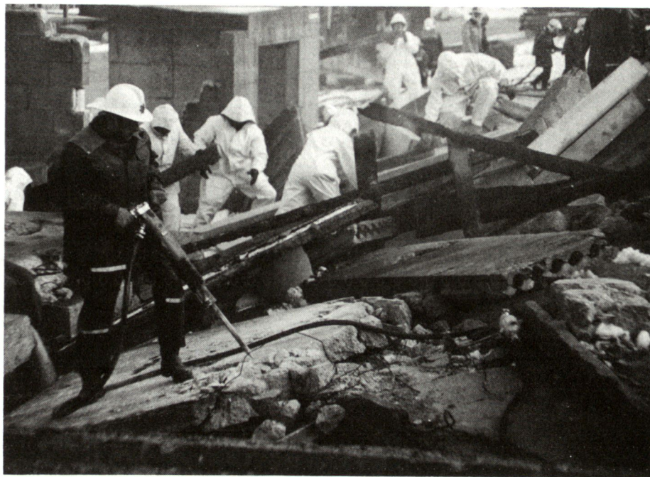
Angehörige des Zivilschutzes und der Rettungstruppen (im weissen Anzug) bei einer gemeinsamen Einsatzübung.

strophenergebnis in der Regel ohne Vorwarnung ein. Die Erfahrungen haben gezeigt, dass die Hilfsorganisationen aus dem Stand zu 100% einsatz- und leistungsbereit sein müssen. Weil aber Katastrophenszenarien nur begrenzt planbar sind und die Führung in ausserordentlichen Lagen zwangsläufig immer auch zahlreiche Improvisationen beinhaltet, kommt der praxisbezogenen Ausbildung laut Bucher ein enorm hoher Stellenwert zu. Er forderte in diesem Zusammenhang dazu auf, von der bisherigen Papierlastigkeit, wie dies bei gewissen Kadern festzustellen sei, wegzukommen. Da zudem die Wahrscheinlichkeit eines Einsatzes durch das neue Konzept erheblich gestiegen sei, stehe und falle die Qualität des Zivilschutzes mit der fachlichen und charakterlichen Eignung der Führungskräfte. Die momentane Umstrukturierungs- und Verjüngungsphase biete eine Chance, geeignete Persönlichkeiten zu rekrutieren.