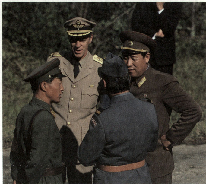
Der Friedensförderungsdienst wird neu im Militärgesetz aufgenommen. Gestützt auf Verordnungsrecht werden derartige Dienstleistungen seit 1953 praktiziert: Angehörige der «Neutralen Überwachungskommission für den Waffenstillstand in Korea» im Gespräch mit nordkoreanischen Offizieren.

Dem Dienst für militärische Sicherheit obliegt zudem der Schutz militärischer Informationen und Objekte. Für die präventive Sicherung der Armee vor Spionage und Sabotage und die Abwehr rechtswidriger Handlungen gegen die militärische Landesverteidigung ist in der ordentlichen Lage allein die Polizei im Rahmen ihrer Aufgaben im Staatsschutzbereich zuständig. Diese Tätigkeiten kann der Sicherheitsdienst der Militärpolizei wahrnehmen, wenn er zum Assistenz- oder Aktivdienst aufgeboden worden ist.