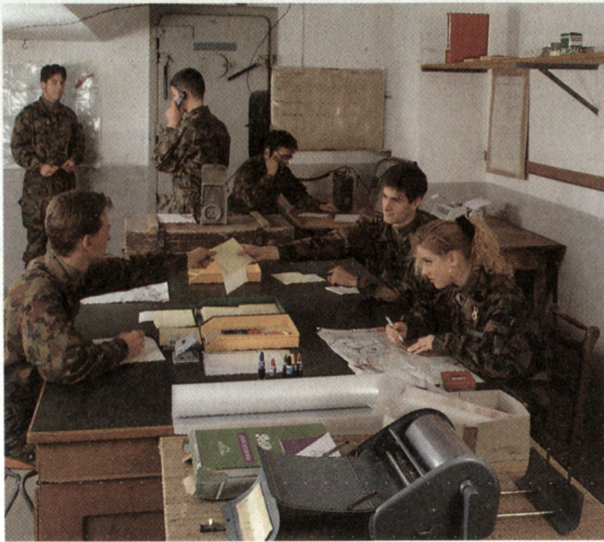
Frauen haben in der Armee grundsätzlich die gleichen Rechte und Pflichten wie die Männer und sind in den Truppengattungen bzw. Dienstzweigen, in welchen sie Dienst leisten, voll eingegliedert.