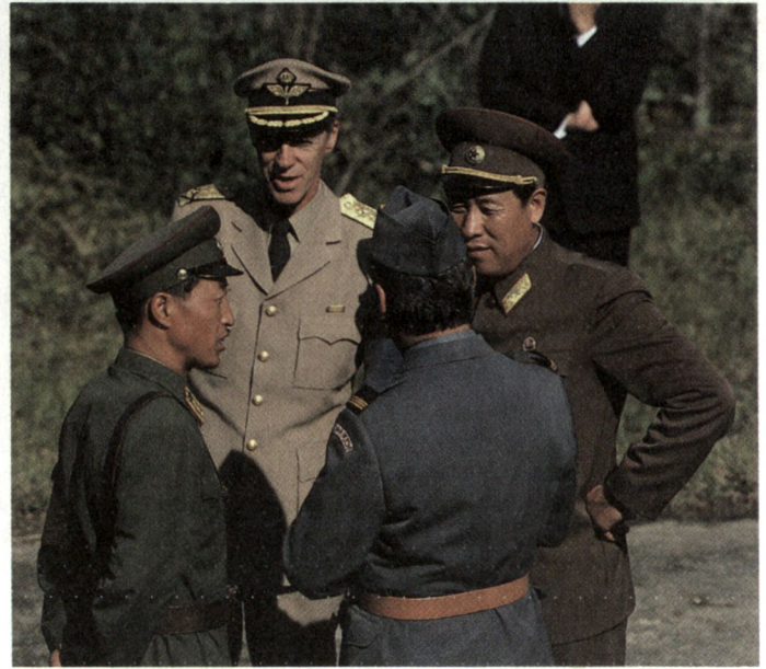
Der Friedensförderungsdienst wird neu im Militärgesetz aufgenommen. Gestützt auf Verordnungsrecht werden derartige Dienstleistungen seit 1953 praktiziert: Angehörige der «Neutralen Überwachungskommission für den Waffenstillstand in Korea» im Gespräch mit nordkoreanischen Offizieren.

Dem Dienst für militärische Sicherheit obliegt zudem der Schutz militärischer Informationen und Objekte. Für die präventive Sicherung der Armee vor Spionage und Sabotage und die Abwehr rechtswidriger Handlungen gegen die militärische Landesverteidigung ist in der ordentlichen Lage allein die Polizei im Rahmen ihrer Aufgaben im Staatsschutzbereich zuständig. Diese Tätigkeiten kann der Sicherheitsdienst der Militärpolizei wahrnehmen, wenn er zum Assistenz- oder Aktivdienst aufgeboden worden ist.