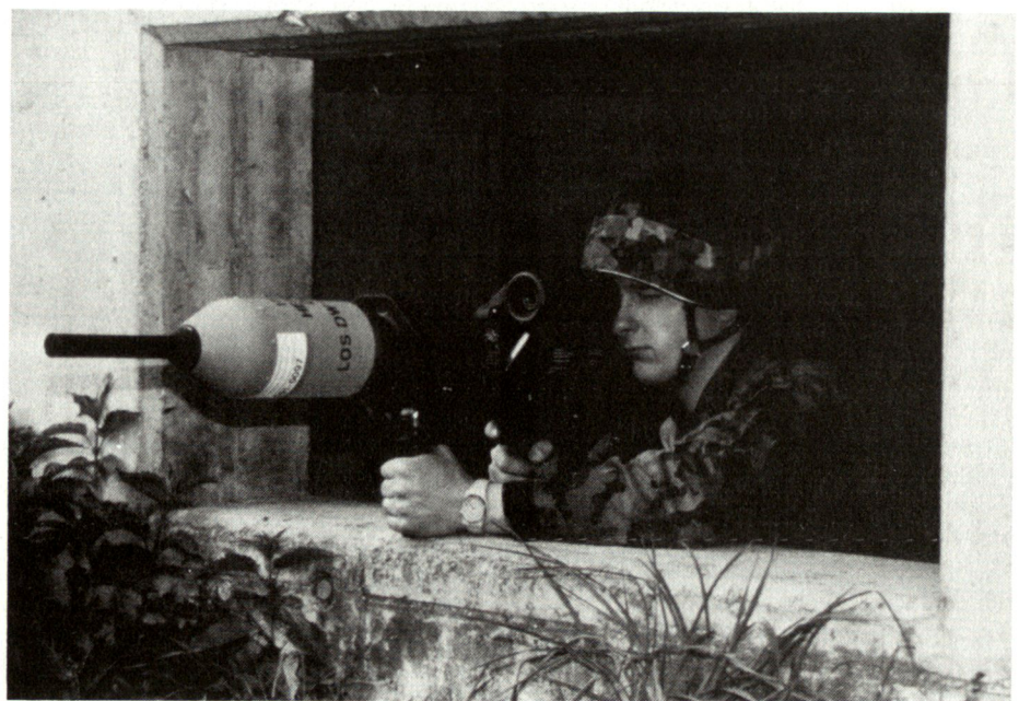
Die traditionelle Aufgabe der Armee bleibt: Durch Verteidigungsfähigkeit hat sie einen Beitrag zur Kriegsverhinderung zu leisten und, wenn nötig, Volk und Land einschliesslich den Luftraum zu verteidigen.

Der Dienst für militärische Sicherheit beurteilt die militärische Sicherheitslage, indem er Informationen auswertet und zu Lagebeurteilungen bzw. Gefährdungsprognosen verarbeitet. Nur in der ausserordentlichen Lage ist die aktive Nachrichtenbeschaffung mit Auftrag des Bundesrats zulässig.