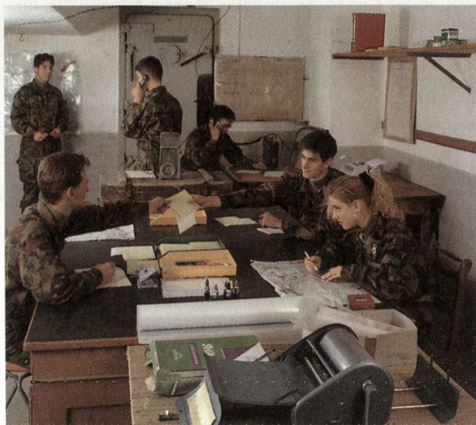
Frauen haben in der Armee grundsätzlich die gleichen Rechte und Pflichten wie die Männer und sind in den Truppengattungen bzw. Dienstzweigen, in welchen sie Dienst leisten, voll eingegliedert.