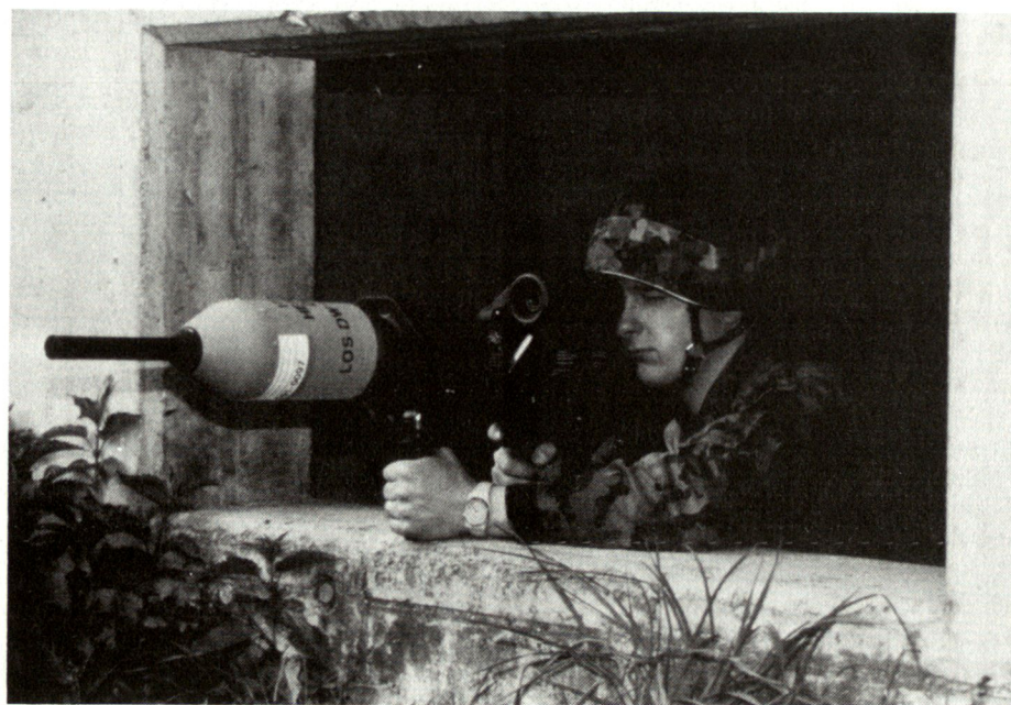
Die traditionelle Aufgabe der Armee bleibt: Durch Verteidigungsfähigkeit hat sie einen Beitrag zur Kriegsverhinderung zu leisten und, wenn nötig, Volk und Land einschliesslich den Luftraum zu verteidigen.

Der Dienst für militärische Sicherheit beurteilt die militärische Sicherheitslage, indem er Informationen auswertet und zu Lagebeurteilungen bzw. Gefährdungsprognosen verarbeitet. Nur in der ausserordentlichen Lage ist die aktive Nachrichtenbeschaffung mit Auftrag des Bundesrats zulässig.