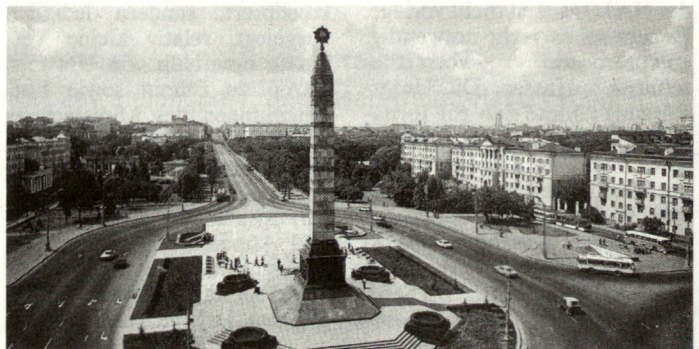
Weissrussland (Bild: Hauptstadt Minsk) ist weiterhin in hohem Masse von Russland abhängig.

Man kann also von «technologischen Risiken und Gefahren» sprechen, und ihre Behebung kann nur durch Hartwährungs-Investitionen in die petrochemische Industrie und ihre Infrastruktur erfolgen. Eine erste Investitionstranche müsste etwa 300–400 Millionen USD ausmachen. Die Republik selbst verfügt nicht über diese Finanzen. Man sucht deshalb nach Projekten, die russisches oder westliches Kapital anziehen könnten, um so die petrochemischen Produktionsstätten und Pipelines restaurieren zu können. Eine bleibende Lösung kann aber nur erzielt werden im Rahmen einer Gesamtreform der Wirtschaft im Sinne des dy-