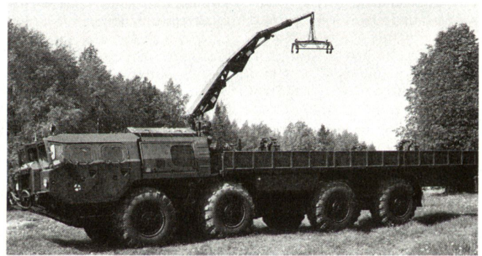
Nachladefahrzeug 9T234-2, ausgerüstet mit einem Kran sowie der Transportkapazität für einen Satz von 12 Raketen.

Mehrfachraketenwerfer MLRS (Kaliber 227 mm) verglichen werden. Das russische System hat allerdings eine bedeutend grössere Schussweite von bis zu 70 km. Die einzelnen Raketen haben dabei ein Gewicht von rund 800 kg, wobei ungefähr 300 kg auf den Gefechtskopf entfallen. Es bestehen diverse Typen von Kassettengefechtsköpfen, die entweder Splitter-Bomblets oder Minen (Personen- oder Panzerabwehrminen) beinhalten. Seit kurzem bestehen für diesen Werfer neue Rakentypen, die über ein Flugbahnkorrektursystem verfügen sollen. Mit Hilfe eines Artillerieradargerätes können somit die Raketenflugbahnen verfolgt und grössere Abweichungen kurzfristig korrigiert werden. Damit dürfte auch über grosse Einsatzdistanzen eine wesentlich verbesserte Zielgenauigkeit erreicht werden.