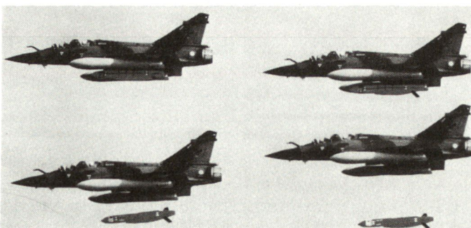
Erster Abschuss eines französischen Marschflugkörpers Apache über 140 km.

Mit diesem Test wurde ein wichtiger Meilenstein der Apache-Entwicklung erreicht. Laut Matra erfolgen die ersten Lieferungen an die Armée de l'Air im Jahre 1998. Bisher hat sich auch die deutsche Luftwaffe für eine Apache-Beschaffung entschieden, und Grossbritannien wird den Flugkörper in die laufende Evaluation einbeziehen. hg