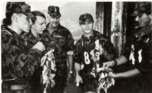
OS 94: Fischzubereitung während der Durchhalteübung.

die Effizienz der militärischen Systeme verstärkt. Die zivilen und die militärischen Kenntnisse ergänzen sich so gegenseitig.