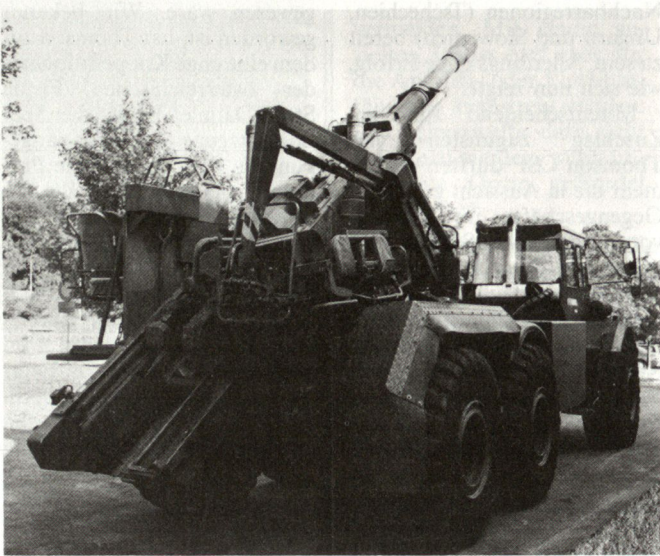
Im Zuge der vorgesehenen Umstrukturierungen soll auch die schwedische Artillerie mobiler gemacht werden (Bild: FH 77 auf neuem Fahrgestell).

wie von 300 Kampfschützenpanzern BMP-1 (Pbv 501) aus Beständen der ehemaligen NVA,