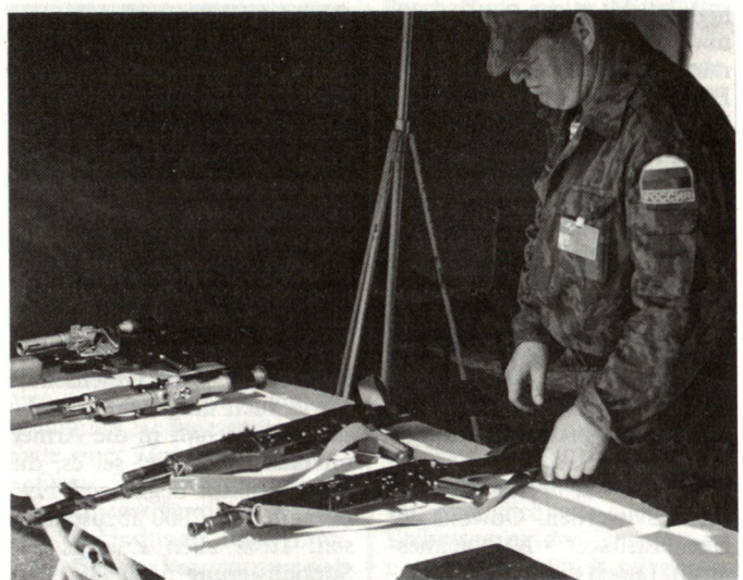
Russischer Soldat bei der Präsentation von Kalaschnikow-Sturmgewehren.

Mit der Produktion von Kalaschnikow-Gewehren wurde vor bald 50 Jahren begonnen. Kalaschnikow soll nach Beendigung des 2. Weltkrieges als Amateur-Bastler die ersten Waffen entwickelt haben. Bevor allerdings die Produktion aufgenommen werden konnte, wurde er durch Stalins Behörden verhaftet. Nur durch Einfluss seiner Kollegen sowie mit Hilfe der Partei kam er wieder