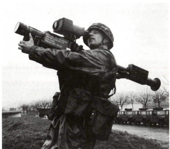
Nachtzielgeräte AN/PAS-18 für Einmann-Flab-Lenkwanne Stinger.

Auch für Mannschaften sei eine spezielle Laufbahn geplant. Er trat vehement für die allgemeine Wehrpflicht ein. Sie sei für die Integration der Streitkräfte in die Gesellschaft sowie auch umgekehrt für die der Gesellschaft in die Armee unverzichtbar. Ziel sei es, die neue Struktur beginnend 1996 bis zum Jahr 2000 abzuschliessen. Trotz allen Zwangs zur Spezialisierung dürfe die Einheit des Heeres nicht verloren gehen. Die Weichen würden aber mit ihr weit über diesen Zeitraum hinaus gestellt. Tp