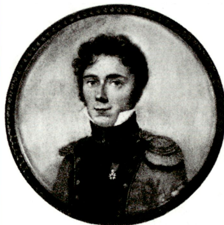
Hauptmann Guillaume-Henri Dufour (1787–1875) von Genéve war von 1811 bis 1817 Genieoffizier in französischen Diensten. 1819 bis 1831 Mitbegründer und Dozent der «Eidgenössischen Militär-Centralschule» in Thun.

Mit der Armeereform 95 war nun die Zeit endgültig reif, um der alten Idee zu einem erneuten Durchbruch zu verhelfen. Damit soll nun aber das grosse Engagement und die – bei solchen Vorhaben nötige – Hartnäckigkeit vor allem des Kommandanten der Zentralschulen nicht geschmälert werden. Die Zentralschulen haben eine wechselvolle Geschichte hinter sich, und ihre jeweiligen Kommandanten – angefangen bei Dufour bis hin zu Divisionär Lipp – mussten für ihre Ideen kämpfen. Im folgenden wird ein kurzer Überblick über die Zentralschulen im Lauf der Zeit gegeben. Dieser basiert – mit der freundlicherweise erteilten Bewilligung der Autoren – auf Beiträgen zu einem im Herbst 1994 erscheinenden Buch zum 175-Jahr-Jubiläum der Zentralschulen.