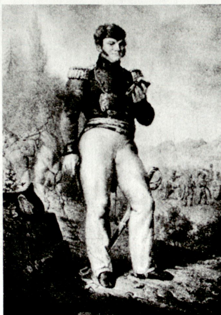
Salomon Hirzel (1790–1844) von Zürich stand als Artillerieleutnant im 2. Schweizerregiment in den Diensten von Napoleon. 1831 Generalinspektor der schweizerischen Artillerie.

In den dreissiger Jahren des letzten Jahrhunderts führten politische Spannungen zu einem Niedergang der Zentralschulen. Nachdem 1835 die Eidgenössische Militäraufsichtsbehörde keine Instrukturen mehr fand, um die Stellen zu besetzen, wurde 1839 der Tiefpunkt der Zentralschulen da-