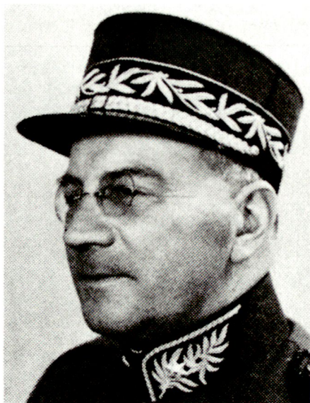
Edgar Schumacher (1897–1967) von Rüschegg (BE) war 1945 und 1946 Kommandant der Zentralschulen. Von 1947 bis 1956 kommandierte er die Felddivision 6.

von Oberstleutnants zu Regimentskommandanten geschaffen. In den fünfziger Jahren wurden diese Kurse zur Zentralschule III-A. Am Ende des zweiten Weltkrieges wurden die Gruppe für Ausbildung sowie das Kommando der Zentralschulen gegründet. Auf Beginn des Jahres 1945 wurde Oberst Schumacher als Kommandant der Zentralschulen gewählt und der Hauptabteilung III, Truppengattungen, unterstellt. Die Kurse für Nachrichtenoffiziere und Adjutanten wurden im Laufe der Jahre in Technische Schulen I und II und Technische Kurse (TK) für Nachrichtenoffiziere