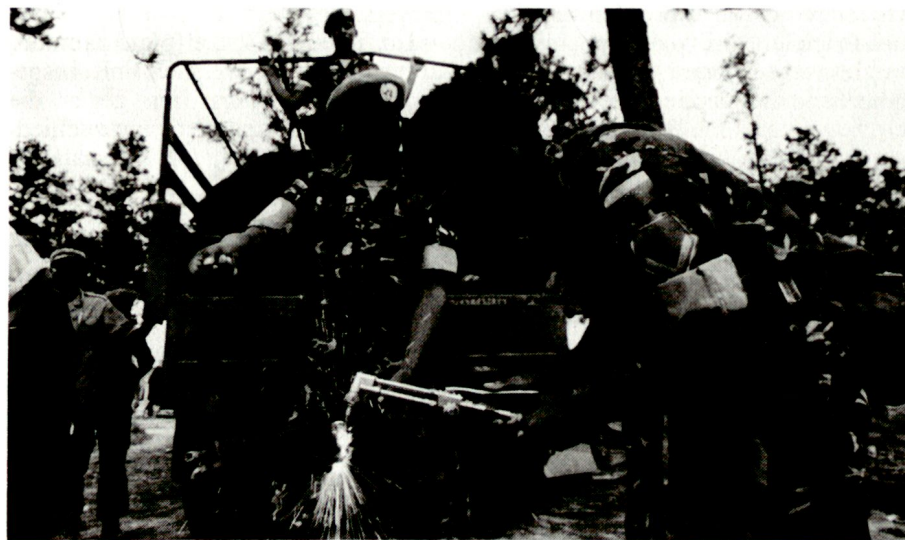
Zerstörung von Waffen, welche die Blauhelme beschlagnahmt haben. Soldat aus Venezuela in der ONUCA, Nicaragua.