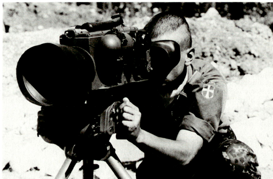
Kalibrierung eines Nachtsichtgerätes für Beobachtungsaufgaben in der Dunkelheit. Dänischer Blauhelmsoldat in der UNPROFOR (Ex-Jugoslawien).

Die UNO ist an allen Staaten interessiert, die Blauhelmsoldaten entsenden, welche die übernommenen Aufgaben zuverlässig erfüllen. Dies ver-