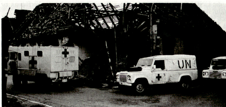
Ambulanzen des britischen Kontingents auf der Fahrt durch Vukovar (UNPROFOR).

Blauhelmsoldaten arbeiten in engem Kontakt mit der Zivilbevölkerung