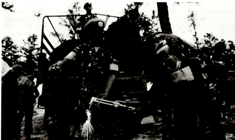
Zerstörung von Waffen, welche die Blauhelme beschlagnahmt haben. Soldat aus Venezuela in der ONUCA, Nicaragua.